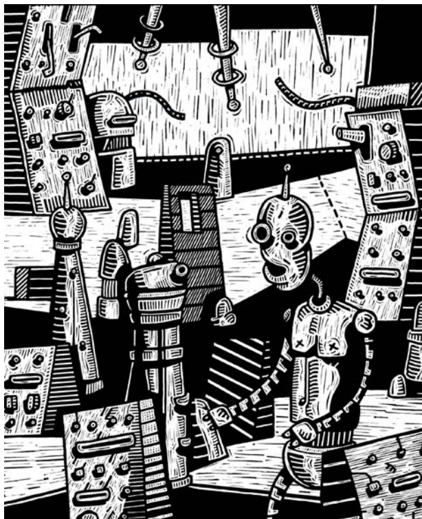
“Sin título”, grabado digital José Florez Nalé

Organizamos y analizamos los resultados obtenidos, diferenciando entre barreras y fortalezas para el aprendizaje.