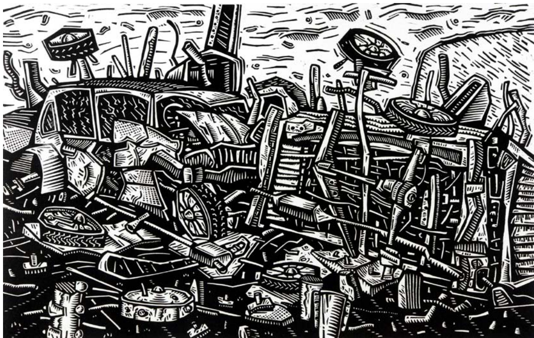
"No detenga su motor", xilografía José Florez Nalé

Fecha de recepción: 27 de mayo de 2013 Primera evaluación: 15 de junio de 2013 Segunda evaluación: 18 de junio de 2013 Fecha de aceptación: 22 de junio de 2013