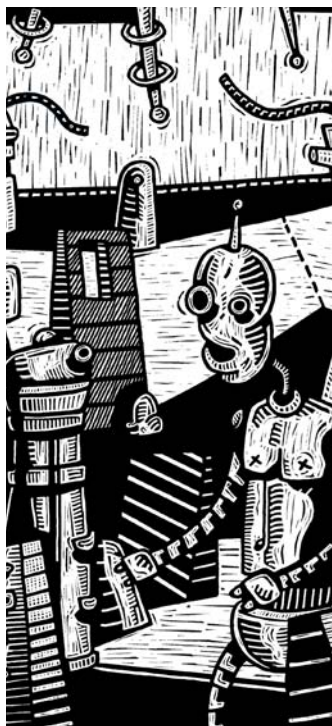
Detalle obra "Sin título" José Florez Nalé