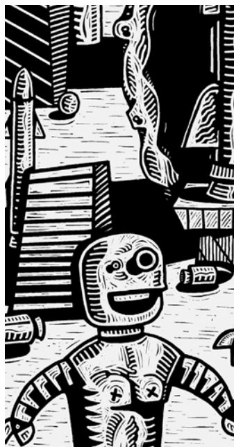
Detalle obra "Sin título" José Florez Nalé