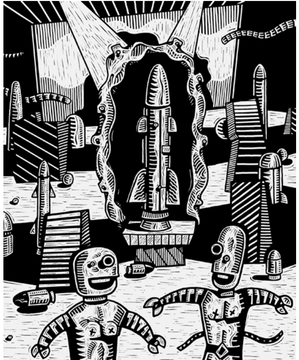
“Sin título”, grabado digital José Florez Nalé

el sujeto se ensaya a sí mismo. La insistencia de Larrosa puesta en la experiencia como “lo que nos pasa” y “no sé lo que me pasa”, se asocia a la posibilidad de pensar la inquietud, el vacío, el cuestionamiento como un momento en donde prima la pregunta que moviliza a detenerse, a pensar las ideas (2005). Es la ausencia de soporte, es decir, una escritura sin soporte de significado verdadero, lo que hace insoportable a la literatura. Y a la filosofía, pese a su auto-adjudicación de verdad. Y a tantos otros discursos, pese a que quieran arrogarse verdad. Si hay soporte, este no puede ser otro que el de las palabras y lo que con ellas podemos hacer. La convicción de este planteo puede hacerse extensivo a otras disciplinas no filosóficas que han heredado, tal vez de la filosofía, un modo de relación con los textos objetivo y autónomo, incluso en la producción artística, como es el caso de la literatura. Es que “Probar’ (expereri) contiene la misma raíz que periculum (peligro), lo que asocia encubiertamente experiencia y peligro” (Jay, 2005/2009: 26) 10 . Probar la propia transformación en el ensayo de la escritura, vuelve a las palabras insoportables, porque no hay estructura que reduzca el significado de las palabras para devolvernos la seguridad de una verdad.