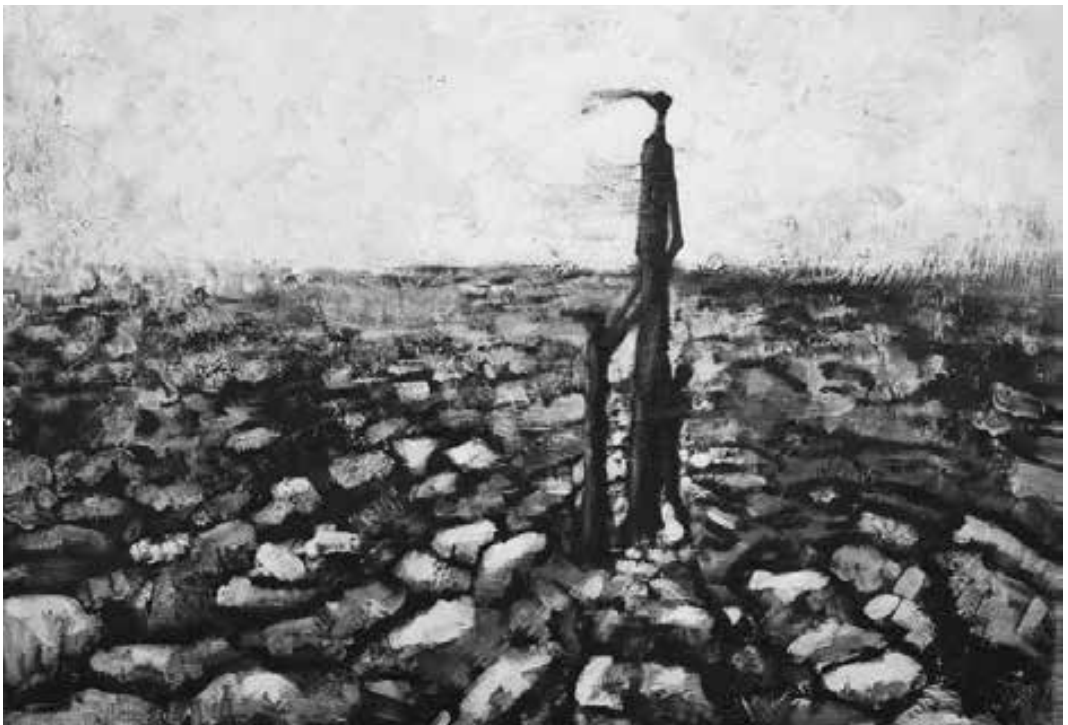
“Tierra árida”, óleo Ricardo Arcuri

Una de las precursoras en implementar el programa insistía en permitir a los estudiantes que elijan sus temas. Pero enseguida se vio en problemas dada la cantidad de estudiantes que querían estudiar “mascotas”, “princesas” y “dinosaurios”. En el segundo año, ella les permitió elegir tres temas, y luego acordaban con ella lo que ella consideraba que sería mejor para cada estudiante en particular. El tercer año, ella llegó a la conclusión de que lo que mejor funcionaba era la asignación de temas al azar.