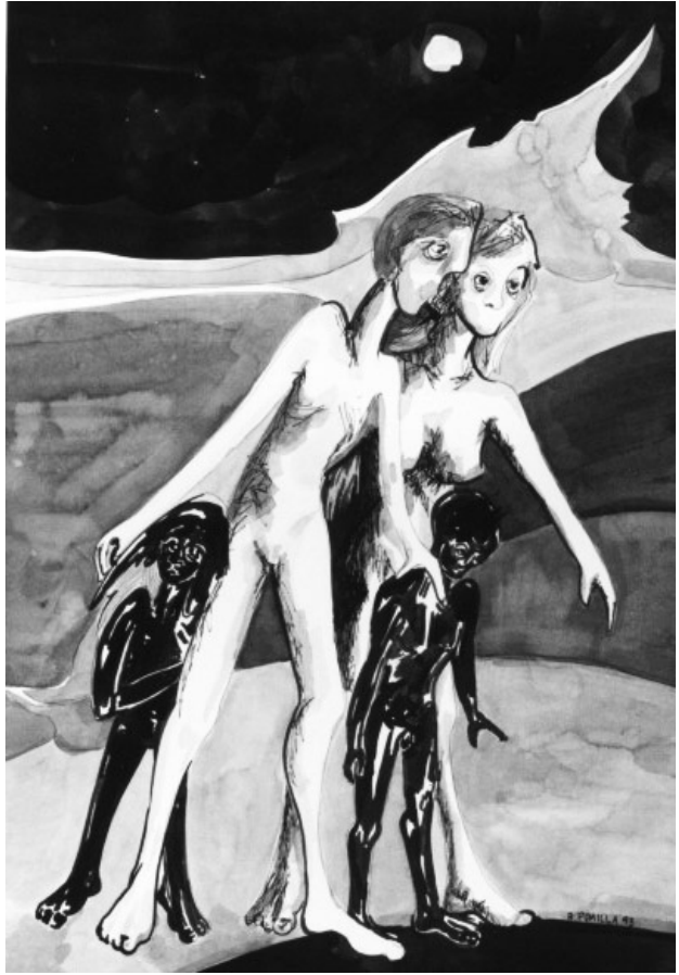
“Una larga pregunta”, tinta sobre cartón Raquel Pumilla

En el presente artículo queremos describir brevemente algunos de los argumentos principales para lograr profundidad de conocimiento y comprender y observar algunos de los méto-