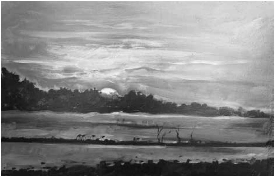
“Bajo Giuliani”, óleo Ricardo Arcuri

La otra innovación pedagógica que hace que este programa funcione es una nueva forma del