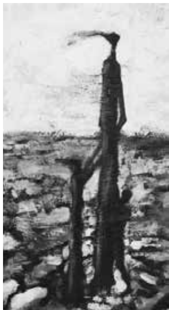
Detalle obra “Tierra árida” Ricardo Arcuri