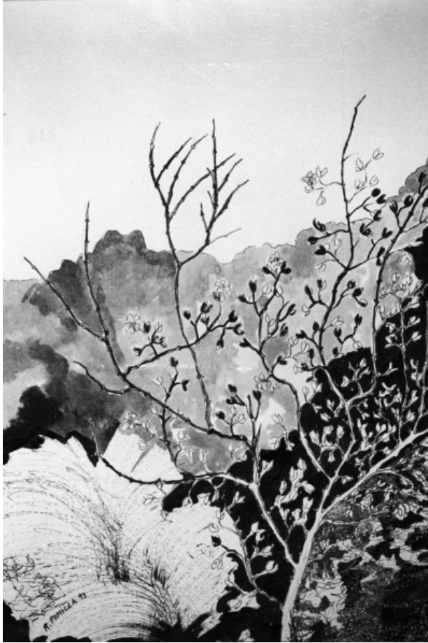
“País de voz quemada”, tinta sobre cartón Raquel Pumilla