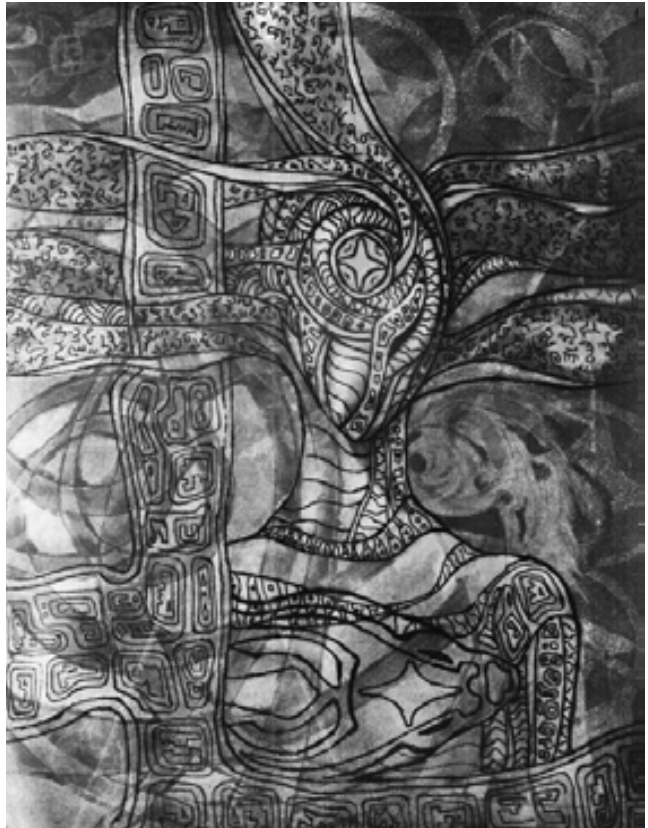
“Sin título XII”, aguafuerte – aguainta Cristina Prado

En ese marco pueden mencionarse algunos programas que, de diferentes maneras, han impactado hacia el interior del SE y, por ende, de la escuela, destinados a promover y difundir el uso