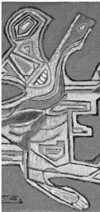
Detalle obra "Habiendo llover", Carlos Oriani