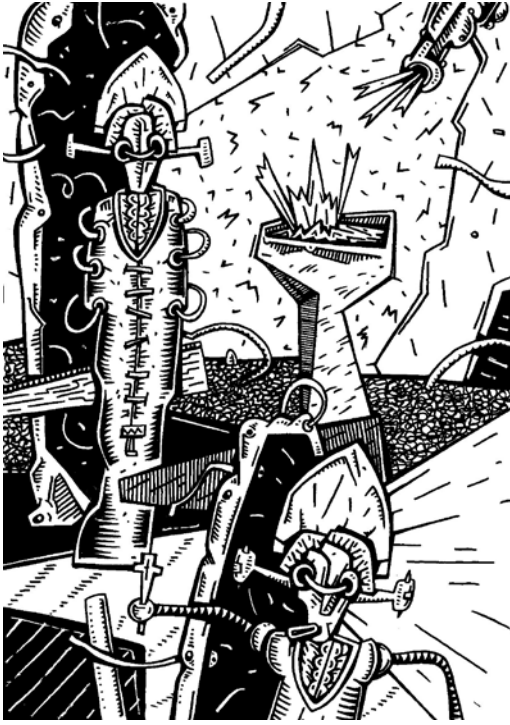
Sin título, tinta José Flórez Nale

por la forma que adquirió el dispositivo didáctico, que sin negar la importancia de la adquisición de conocimientos científicos y no científicos favoreció en modo particular el juego intersubjetivo de los actores institucionales, tal vez haya sido la experiencia de “Escuela Serena” realizada por las hermanas Cossetini en Rosario. La libertad, favoreciendo la espontánea creatividad del niño y transcurrir serenamente por los más variados caminos de la comunicación entre pares y adultos, fue el paisaje psicológico que la contuvo.