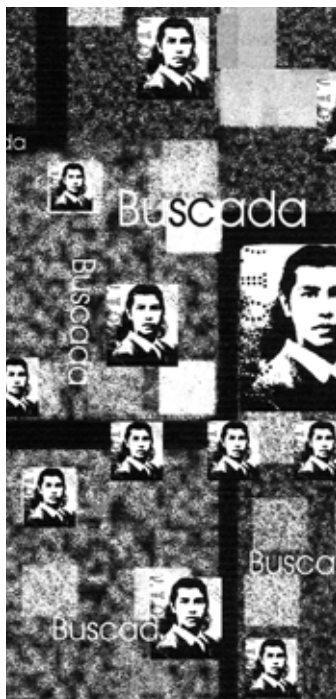
Detalle obra "Buscada" Ada Bernárdez