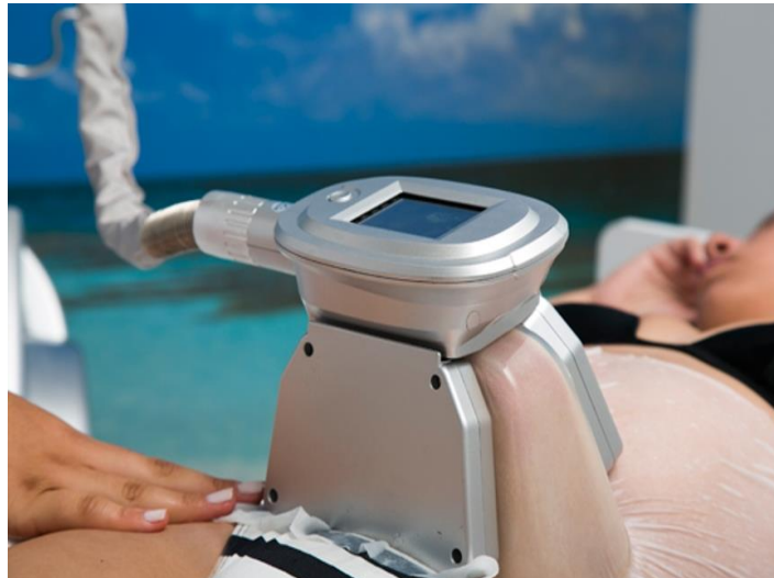
Figura 2: Criolipólise

(Klein, Zelickson, Riopelle, Okamoto, Bachelor & Harry, 2009 citado por Almeida, Antônio, Oliveira, Rollemberg, Vasconcellos, 2015).