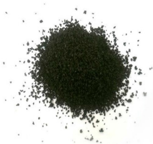
Figura 1 Grânulos de pneus [10].

Os materiais utilizados foram: cimento Portland CPV-ARI de alta resistência inicial e agregado miúdo (areia), os quais foram caracterizados segundo as normas específicas NBR 7215, NBR 9776, NBR NM 45 e NBR 7217 [10-13]. Os grânulos de pneus foram obtidos da empresa RACRI localizada na cidade de Betim (MG). A granulometria utilizada foi a da malha 10 mesh com tamanho de grão de 1,05 mm à 2,47mm, conforme nos mostra a figura a seguir.