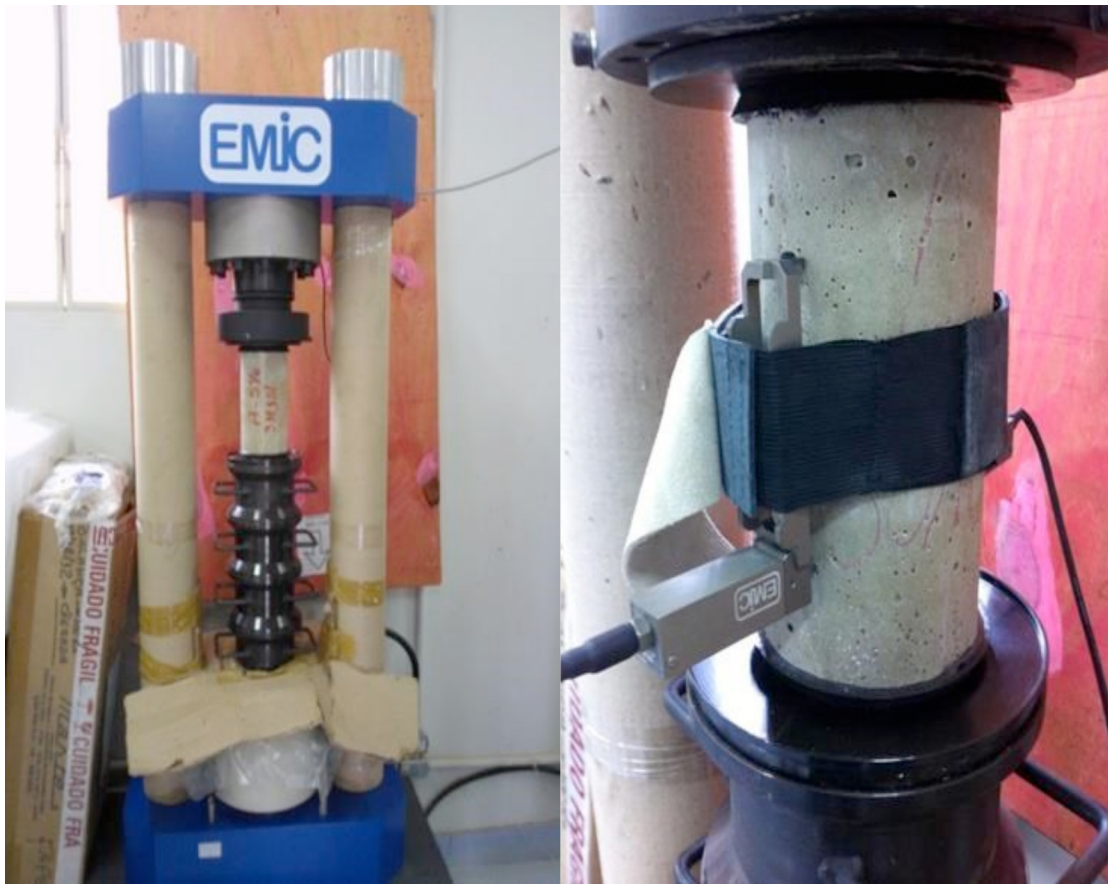
Figura 3 Ensaio de resistência à compressão e módulo de elasticidade.