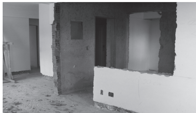
Figura 3 : Alteração do projeto original pelo proprietário.

Solicitações de novas mudanças (leia-se projetos) também ocorreram após a direção da construtora decidir pela troca dos aquecedores de passagem para aquecimento de água, pela instalação de chuveiros elétricos em todos os banheiros das unidades residenciais, alterando significativamente a carga elétrica anteriormente projetada e aprovada (projeto de entrada de energia). Dessa forma, a construtora optou pela economia como um todo, visto que a fiação, a tubulação de água quente (que deixou de existir) e as colunas de alimentação de água fria, para os aquecedores de passagem, foram retirados.