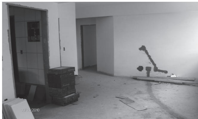
Figura 4 : Alteração no projeto elétrico pelo proprietário.

Essa economia, entretanto, foi diluída nas várias alterações ocorridas durante todo esse processo, provocando um desgaste desnecessário que poderia ter sido evitado caso, todos os projetos tivessem sido discutidos e analisados previamente antes do início da obra. Conforme pode ser apurado, os contratos de venda das unidades permitiam alterações nas mesmas, pelos futuros compradores, provocando intervenções de toda ordem em várias unidades, gerando custos adicionais não previstos (FIG3 e FIG4).