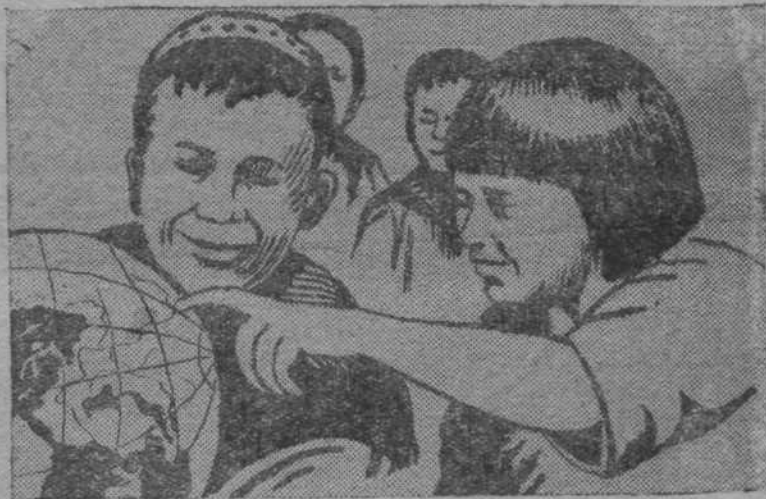
Наши дети любят и уважают свою страну. При первом знакомстве с глобусом их прежде всего интересует где находятся границы Союза Советских Социалистических Республик.

Все без исключения народы Союза принимают участие в строительстве социализма. Народы, экономически и культурно более развитые, помогают народам отсталым. В этом—основное принципиальное отличие нашей национальной политики от политики капиталистических стран, где сильные угнетают и грабят слабых.