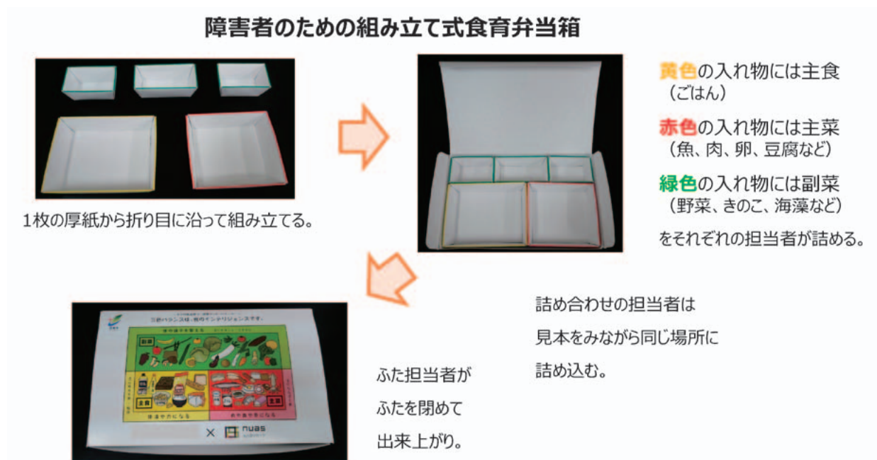
図2 障害者就労支援のための食育弁当箱

作成献立数は113献立でおおよそ半年間のサイクルメニュー化を実現した。我々の献立作成前後における弁当の栄養素および、食品群別重量の比較を表1に示した。栄養素の比較では、献立提供後、エネルギーは846.7kcalから633.3kcalへ有意に低下し ( P<0.001 )、脂質は33.0gから20.1gへ有意に低下した ( P<0.001 )。炭水化物では、105.9gから90.6gへ有意に低下し ( P=0.002 )、食塩相当量も4.9gから2.2gへ有意に低下した ( P<0.001 )。献立提供後、食物繊維総量は3.1gから5.2gへ有意に増加した ( P=0.001 )。一方、たんぱく質に献立提供前後において有意な変化はなかった。ビタミン・ミネラルに関しては、献立提供後、ナトリウムは1936.1mgから889.3mgへ有意に低下し ( P<0.001 )、カリウムは700.1mgから1043.3mgへ有意に増加し ( P=0.003 )、ビタミンCも26.3mgから51.6mgへ有意に増加した ( P=0.016 )。エネルギー