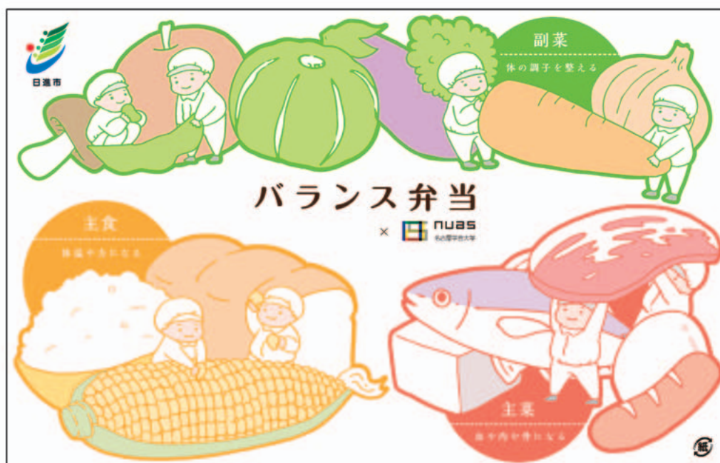
図4 我々のプロデュース前 (A) とプロデュース後 (B) のデザイン