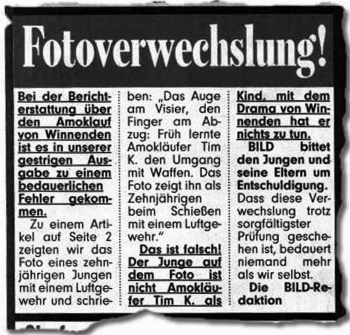
Abb. 5: Richtigstellung in der „Bild“-Zeitung vom 14.3.2009.

des Täters genannt, karikiert sich diese Richtlinie des Leitfadens selbst, denn oftmals haben die Täter Geschwister, die durch diese Namensnennung ebenfalls bekannt werden und für die das weitreichende Konsequenzen hat. Schon aus diesem Grund sollte auf die volle Namensnennung des Täters verzichtet werden. Ein zweiter Grund wird durch ein Beispiel anschaulich illustriert.