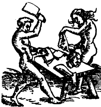
Abb. 4: Münster, Cosmographie , Basel 1588

Wann im dann die haut abgefegēt iſt/nimpt in eynmans perſon/ ſchneidet im die beyne vber den Enſchen ab/vnnd die arme an dem leibe/ dann kōmen die vier weiber vnd nemen die vier ſtücke/ vnd lauffen mit vmb die hūlten her/machen eyn