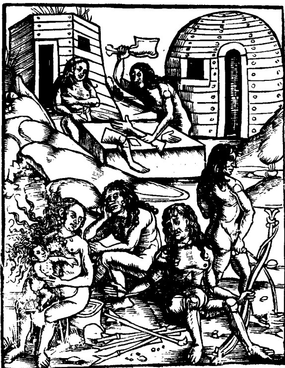
Abb. 2: Vespucci, Vier Seefahrten Diß Būchlin saget, Straßburg 1509