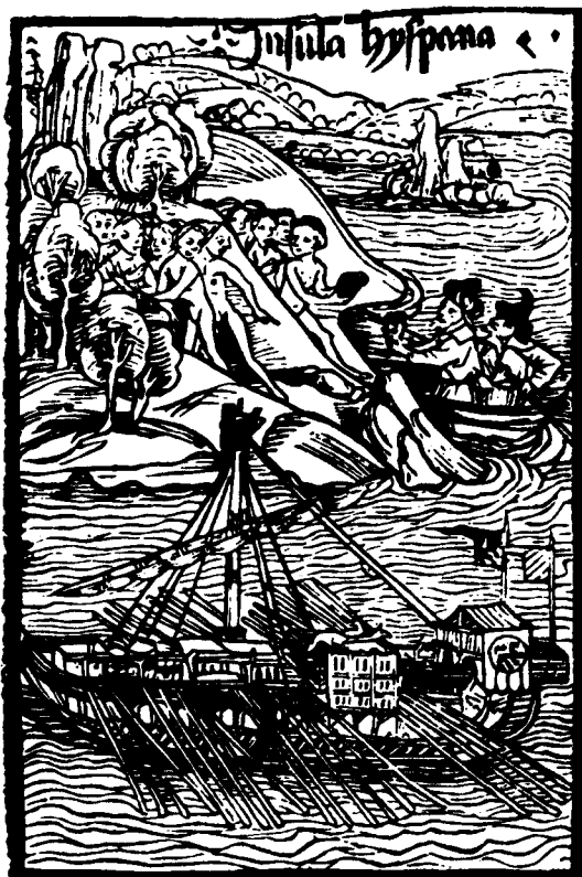
Abb. 1: Erster Kolumbus-Brief De insulis nuper inventis , Basel 1494