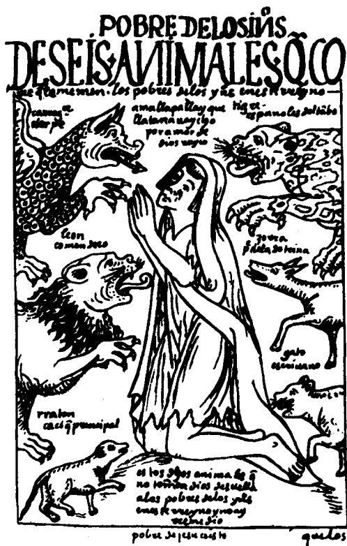
Abb. 8: Guamán Poma de Ayala, Nueva Corónica, um 1600

Einen Höhepunkt des ikonischen Erzählens stellt eine andine „Christus-Ikone“ dar, die einen zerlumpten Indio zeigt, der von sechs Tieren bedroht wird, die all jene Mächte symbolisieren, denen der Indio schutzlos ausgeliefert ist: Es sind der Drache (= Corregidor), der Löwe (= Kommendenbesitzer), die Ratte (= indianischer Kazique), der Tiger (= Spanier der Gasthäuser), der Fuchs (= schlechter Priester) und die Katze (= Schreiber). Die bedrohte Gestalt ist der „arme Indio“ (pobre de los indios), den Guamán Poma mit dem „armen Jesus Christus“ (pobre de Jesucristo) identifiziert (Abb. 8). „Denn man muß im Glauben klar erkennen“, sagt Poma an anderer Stelle, „daß dort, wo der Arme ist, auch Jesus Christus ist, und dort, wo Gott ist, auch Gerechtigkeit.“ 35 Diese Identifizierung spielt auf die neutestamentliche Perikope des Weltgerichts an (Mt 25,31-46), die auch in der heutigen Theologie Lateinamerikas eine Schlüsselrolle spielt. Wie die Bilderchronik des 16. Jahrhunderts, so zielt auch die lateinamerikanische Theologie des 20. Jahrhunderts auf Befreiung in all ihren Dimensionen. Die zwei Gestalten des Guamán Poma de Ayala und des Bartolomé de las Casas führen uns wieder in die Gegenwart, denn ihre Inspiration wird von einem führenden Theologen wie Gustavo Gutiérrez aufgegriffen und uns als frühe Wahrnehmung und Respektierung des anderen vor Augen gestellt. 36