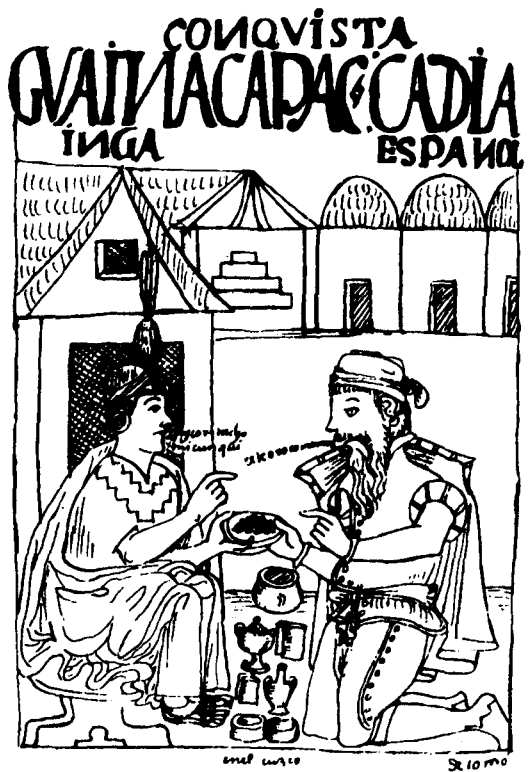
Abb. 7: Guamán Pomo de Ayala, Nueva Corónica , um 1600

Der zweite Teil beschreibt vor allem die spanische Conquista und Kolonialherrschaft in den handelnden Personen des Vizekönigs, des Klerus, des Militärs, der Geschäftsleute. Angesichts des schreienden Unrechts, das den „armen Indios“ angetan wird – viele Zeichnungen denunzieren die Unterdrückung, Mißhandlung, Übervorteilung und ungerechte Bestrafung -, protestiert der Autor vehement gegen diese Herrschaft, indem er an das königliche Gewissen appelliert. Der König als Adressat der Brief-Chronik soll für eine „gute Regierung“ in der Neuen Welt sorgen, die den Indios ihre angestammten Rechte und ihr Reich läßt und sie vor den „schlechten Spaniern“ schützt. Der Text ist dreisprachig verfaßt, in phonetischem Spanisch, in Quechua und Aymar. Die Bilder illustrieren nicht den Text, son-