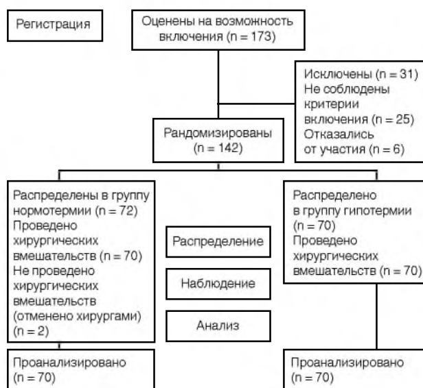
Рис. 1. Диаграмма распределения пациентов Fig. 1. Patients' distribution chart

Примечание: качественные признаки представлены в виде абсолютных значений (%), количественные признаки – в виде среднее ± стандартное отклонение либо медиана (25-й; 75-й процентиль).