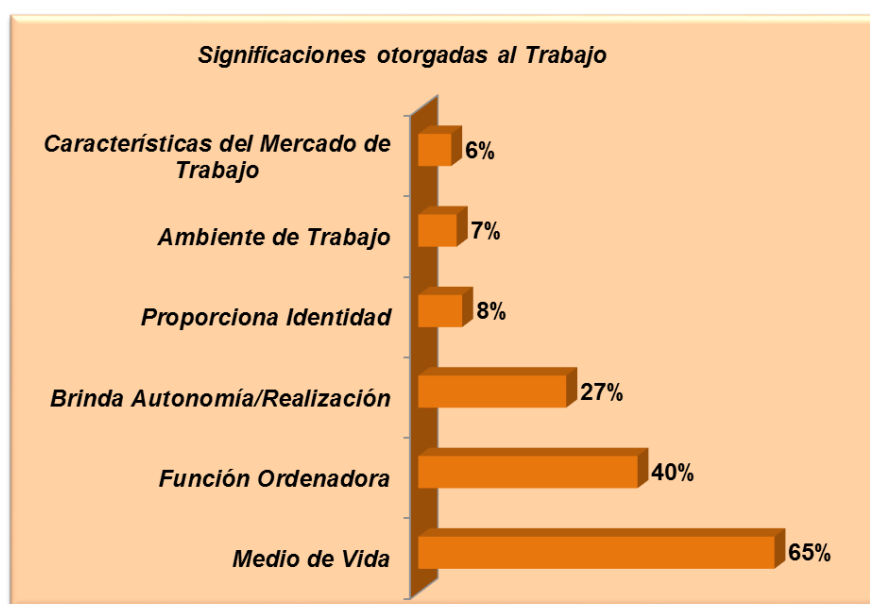
Gráfico N° 1

Respecto al Buen Trabajo , los jóvenes señalan las mismas categorías que mencionaron para referirse al concepto Trabajo . En este caso estos valores son evocados en su aspecto positivo: así, cuando se refieren al Buen Trabajo como medio de vida, podemos observar que se aproximan al concepto de trabajo decente desarrollado por la OIT. En este sentido, no sólo es el trabajo que permite la subsistencia, sino el trabajo que permite una subsistencia digna, bien remunerado y con todos los beneficios sociales. En esta dimensión hacen referencia, además, a las características del mercado de trabajo: el "Buen Trabajo" es el registrado, bien remunerado, con existencia de oferta . Señalan que en la actualidad esas condiciones no se dan, el buen trabajo no existe . Se presentan también, categorías que aluden al Buen Trabajo como aquel "trabajo deseado", son aquellas actividades anheladas, que en algunos casos la vinculan a un trabajo registrado, en otros a una actividad independiente que produce gratificación y en otros al desempeño profesional; estas categorías fueron incluidas en la dimensión que denominamos psico-social.