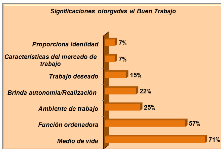
Gráfico N° 2

responsabilidad, puntualidad, esfuerzo, voluntad, obligación . Otro aspecto señalado (27%), es que el trabajo brinda la posibilidad de lograr autonomía y realización personal , comprende los valores señalados tales como independencia, crecimiento personal, experiencia . El trabajo visto como realización se comprende en los jóvenes dado que en la etapa evolutiva éstos precisan proyectarse en tareas vinculadas a la autorrealización. El trabajo visto y significado como Identidad es elegido con menor frecuencia (8%): hace alusión al reconocimiento social. Lo expresan con palabras tales como ser alguien, dignidad, respeto . El ámbito laboral es señalado en un porcentaje menor (7%) en el cual los jóvenes se refieren a las condiciones de trabajo. Al mencionar el mercado de trabajo , los jóvenes se expresan con la siguiente manera: escaso, lo que hay, no existe, no registro , dan cuenta de esto un pequeño porcentaje (6%).