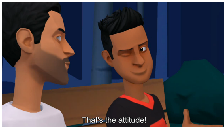
Figura 2. Ejemplo 1 realizado por el alumnado (elaboración propia)

El alumnado participante en esta innovación educativa la valoró muy positivamente mediante la realización de una entrevista no estructurada al final de la segunda sesión, donde se destacó la gran motivación que había supuesto enfrentarse a una actividad completamente nueva y que les permitía desarrollar tanto su competencia lingüística en lengua inglesa, como su creatividad y el uso de la tecnología. Esto, a su vez, se reflejó en el desarrollo de los vídeos en animación 3D (Figs. 2-3).