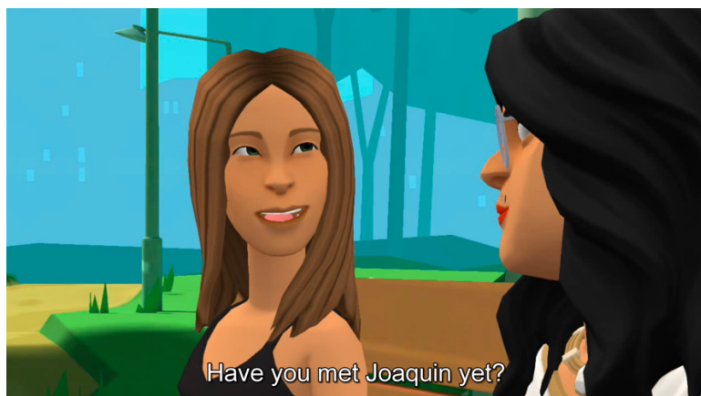
Figura 3. Ejemplo 2 realizado por el alumnado (elaboración propia)

Por todo lo anterior, podemos afirmar que tanto los resultados obtenidos como la valoración de la innovación por parte del alumnado fueron muy positivos, lo cual nos anima a continuar desarrollando esta innovación metodológica en los próximos cursos.