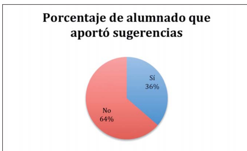
Gráfico 4. Porcentaje de alumnado que dio su opinión abierta sobre la presentación en lengua inglesa

En el cuestionario distribuido en Oficina de Proyectos se dejó una pregunta abierta para sugerencias. El gráfico 4 resume el porcentaje de alumnado que dio su opinión ante esta pregunta: