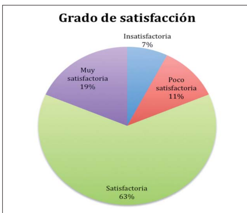
Gráfico 1. Grado de satisfacción del alumnado participante en la experiencia

Al finalizar el curso se le pidió al alumnado que rellenara unas encuestas de satisfacción ligeramente distintas para las asignaturas de Balística y de Oficina de Proyectos (para obtener un espectro de evaluación más amplio). En la asignatura de Balística, de los 28 alumnos matriculados, 27 rellenaron dicha encuesta (un alumno no rellenó la encuesta ya que no asistió a clase ese día). 3 El gráfico 1 ilustra el grado de satisfacción del alumnado con esta experiencia de innovación docente: