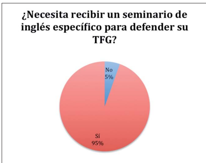
Gráfico 3. Resumen de respuestas de los alumnos de Oficina de Proyectos

En el cuestionario distribuido en Oficina de Proyectos se dejó una pregunta abierta para sugerencias. El gráfico 4 resume el porcentaje de alumnado que dio su opinión ante esta pregunta: