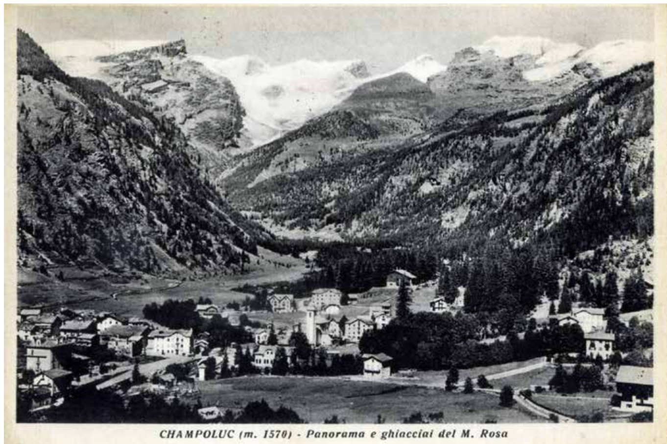
CHAMPOLUC (m. 1570) - Panorama e ghiacciai del M. Rosa

Champoluc in una cartolina d'epoca degli anni cinquanta del Novecento. Al centro il pianoro in cui è stato realizzato il Palazzetto dello sport.