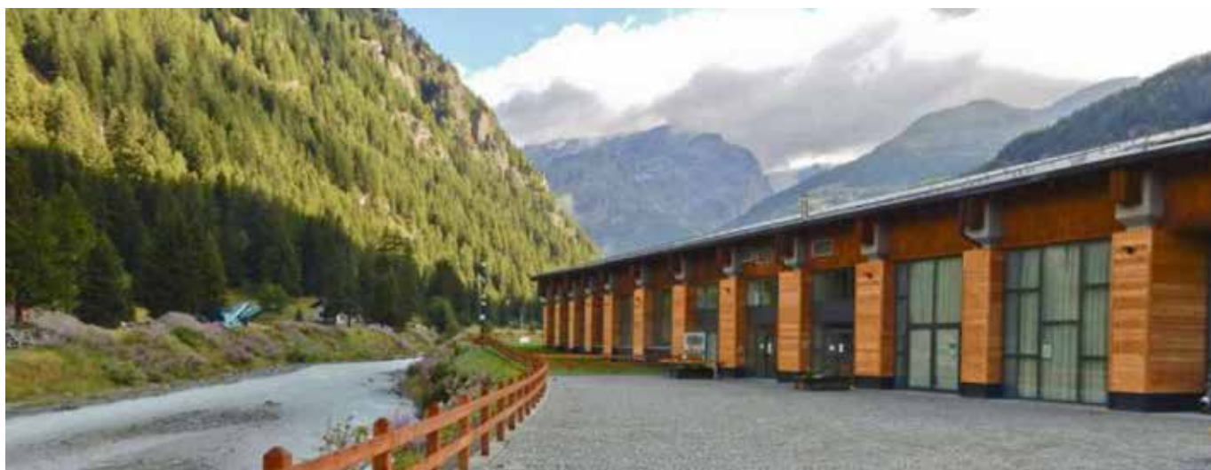
Il prospetto sul fronte verso il torrente Evançon. È riconoscibile il ritmo della struttura originaria, costituita da pilastri in calcestruzzo e travi in legno lamellare (Archivio studio Fabrizio Bianchetti).

ricondursi al significato di sistema territoriale, per favorire il processo di attrazione cumulativa che la rete stessa favorisce, in relazione ai flussi di ricettività.