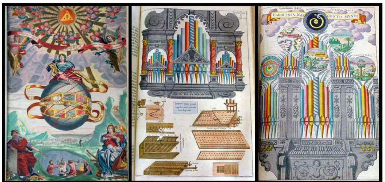
Fig. 3 - Tavole tratte da: Athanasii Kircheri, Musurgia Universalis sive ars magna consoni et dissoni (...), 2 tomi. Roma, Haeredum Francisci Corbelletti 1650. Frontespizio , tomo 1; Tavola interposta alle pp. 500-501, tomo 1, Harmonia nascentis mundi , tavola interposta alle pp. 366-367, tomo 2. Le immagini sono tratte da una rara copia acquerellata dell'editio princeps, conservata presso l'Università di Glasgow, SpColl Ferguson Af-x 9-10.

Il titolo di questa sua opera così come il motto: “ sicut tenebre eius it a lumen eius ”,