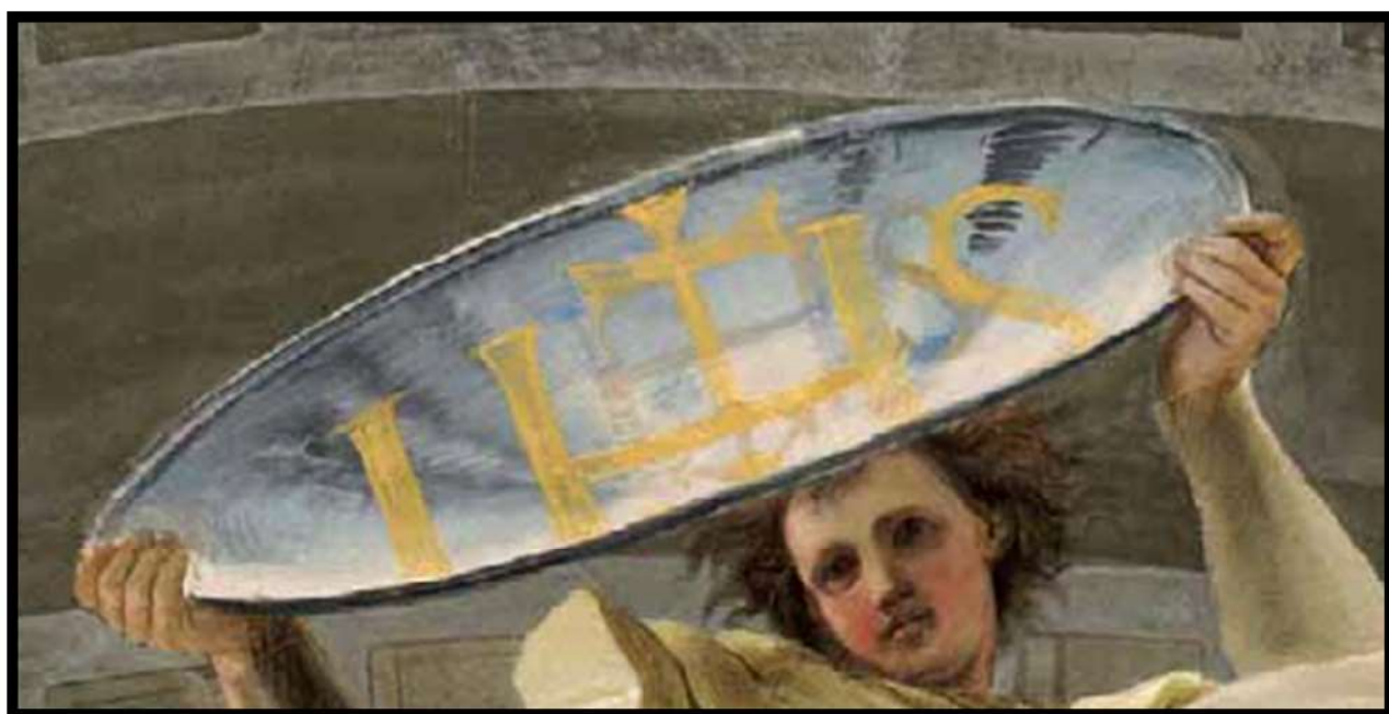
Fig. 1 – Andrea Pozzo, Gloria di Sant'Ignazio 1685, particolare dell'angelo con specchio concavo. Chiesa del Santissimo Nome di Gesù, Roma.

richiamava visitatori da tutta Europa. Per alcuni lustri, la stupefacente raccolta fu uno dei luoghi più visitati di Roma. Quando Pozzo giunse a Roma, nel settembre del 1681, Kircher era morto da quasi un anno ma il suo museo era ancora straordinariamente vivo. “L’angelo che sulla volta di S. Ignazio tiene uno specchio concavo per riflettere l’immagine divina sotto forma di Cristogramma è presumibilmente un segno del fascino subito dall’artista di fronte alle macchine catottriche kircheriane. Se non dai libri del padre gesuita, Pozzo deve aver appreso dal curatore del museo che lo specchio concavo, oltre ad accendere il fuoco (immagine simbolica di Ignazio che accende la fede dell’umanità), mostra le immagini fuori dalla sua superficie, facendole apparire sospese a mezz’aria (immagine simbolica di Ignazio che riflette la gloria divina)” [35].