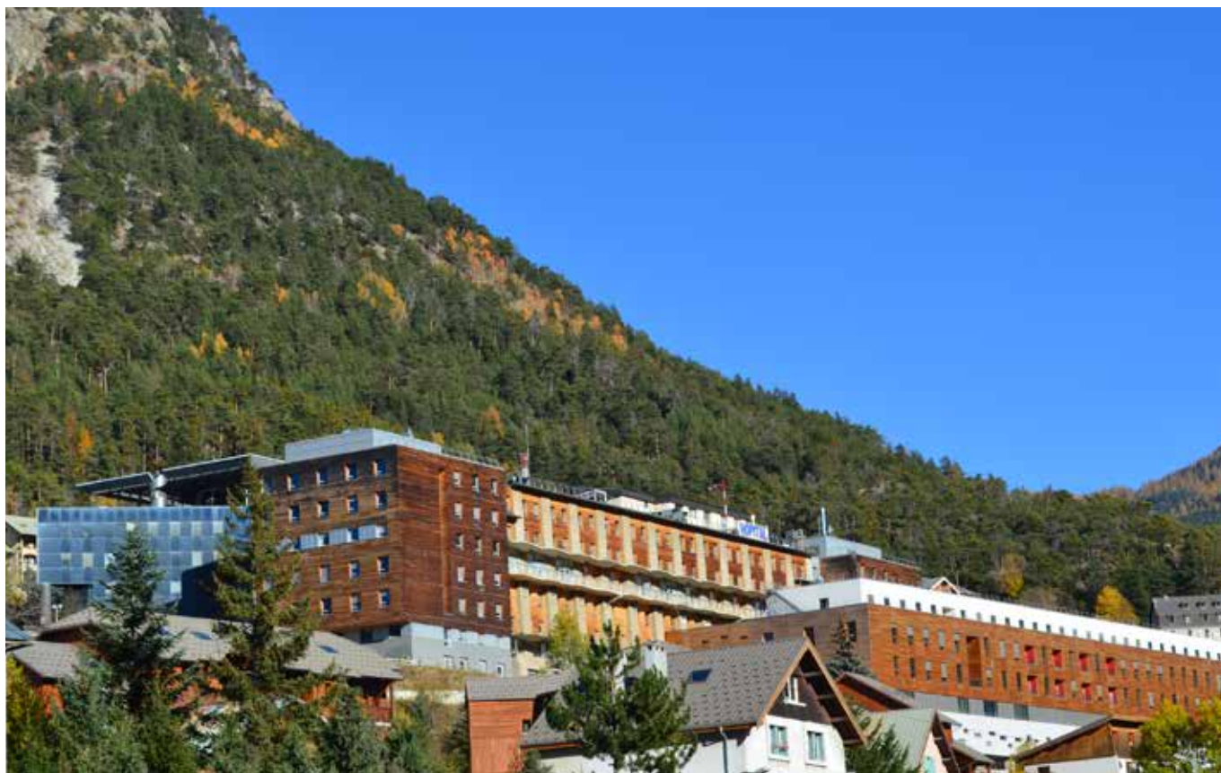
L'ospedale civile di Briançon: in alto, i volumi aggiunti nel secolo scorso; al centro, il corpo originario con i recenti ampliamenti e il retrofit dei fronti; in basso, il nuovo CMRA (fotografia di Alessandro Mazzotta, 2017).