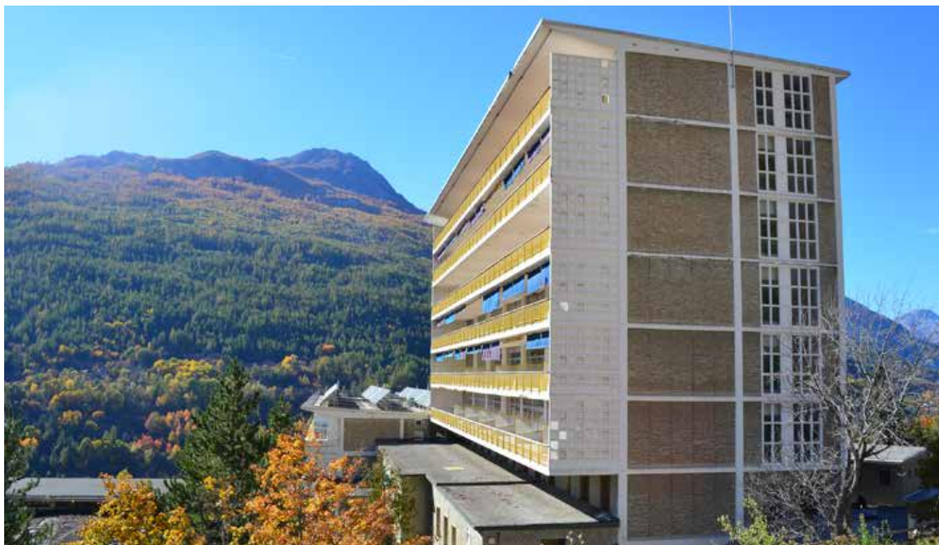
Il volume più alto tra gli edifici per il ricovero: sul fronte sud, i telai degli originari serramenti in alluminio erano realizzati secondo il système Prouvé, con vetrate Thermopane.

che inquadrano la tematica, intrecciando spunti da differenti ambiti disciplinari.