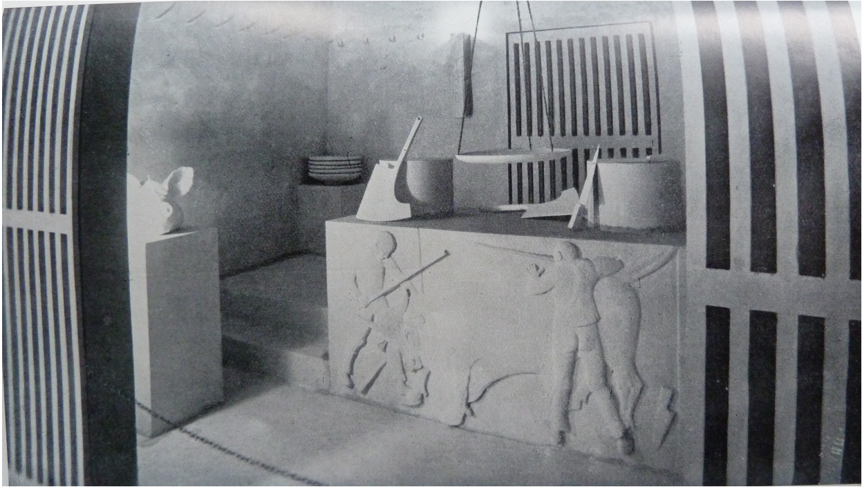
Felice Casorati, Macelleria alla Biennale di Monza, 1927, Sezione Piemontese

La direzione tracciata, più o meno consapevolmente, dalla via dei negozi piemontese alla Biennale, prosegue essenzialmente sulla scorta di un concetto molto pragmatico: i negozi sono soprattutto una faccenda di comunicazione. Non a caso la sequenza cibo (industrializzato o semindustrializzato), progettista e ricerca di un'immagine forte avviene proprio in occasione dell'insediamento di locali commerciali direttamente commissionati dalle aziende.