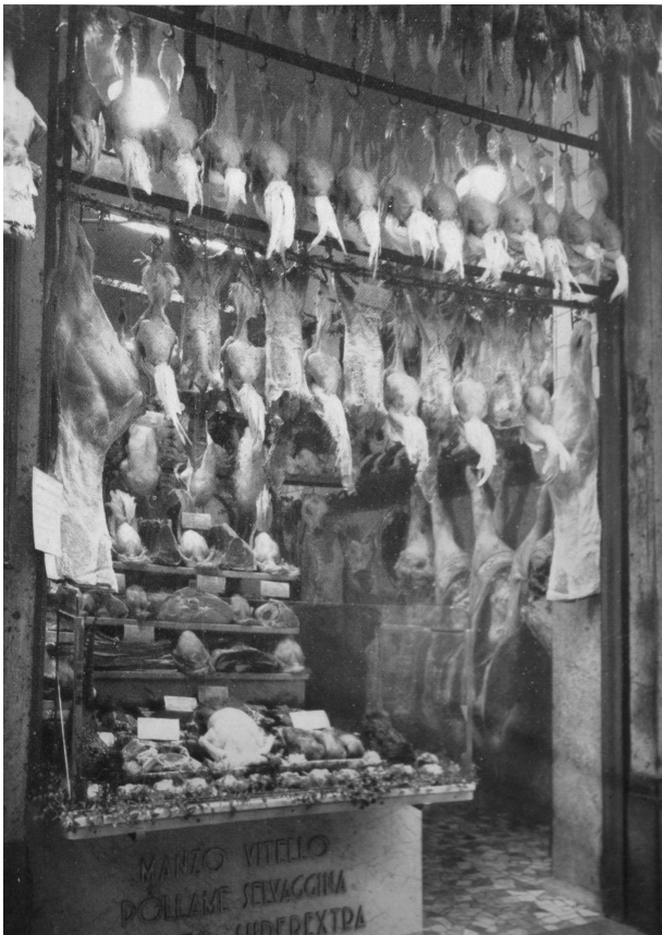
Macelleria a Milano, in “Negozzi e vetrine”, a.1958 n.7 p.14

Ma, “la situazione dell'architettura in Italia non è quella che appare nelle riviste specializzate”, recita il titolo di un articolo di Renzo Marchelli, pubblicitista e componente di spicco della redazione di “Negozzi e vetrine” 45 , rivista pubblicata a Milano nel 1957 e 1958 con l'obiettivo, verosimilmente sfumato, di lanciare organizzazioni professionali di categoria e di assistere i negozianti, con un efficace sistema di consulenze pubblicate sui diversi numeri, nelle questioni relative alla comunicazione, ai disbrighi legali e fiscali, all'allestimento di negozi e vetrine, appunto.