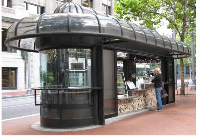
Fig. 5 – Kennedy Plaza, il progetto d'intervento, vista a volo d'uccello. L'intenzione di potenziare le relazioni fisiche e sociali è evidente; in continuità con l'impianto morfologico esistente, lo spazio pubblico viene restituito alla collettività, ampliando la porzione pedonale e inserendovi funzioni che favoriscano l'interazione e la vitalità sociale.

fermata nel complessivo processo di strutturazione dell'ambiente e del paesaggio urbano. Considerando in ordine crescente il ruolo della fermata, la selezione muove da progetti in cui essa è parte di un complessivo progetto di riqualificazione, all'interno del quale si inserisce in modo leggero e discreto, per giungere a progetti in cui la fermata è in sé protagonista.