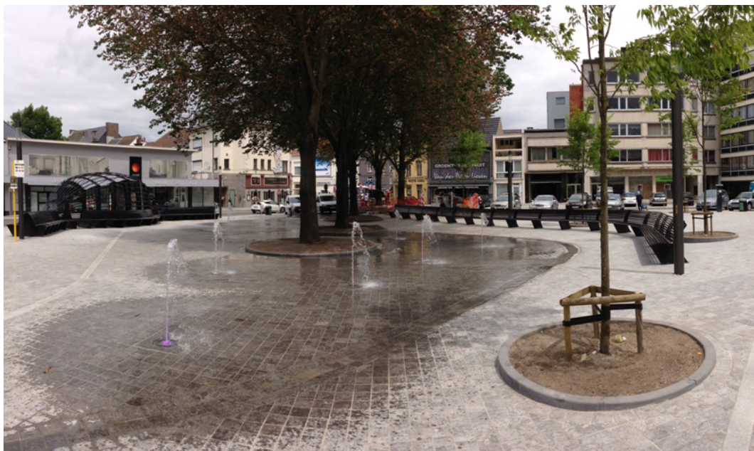
Fig. 6 – Kanunnik Colinetplein, vista d'insieme: a sinistra la fermata, cui si coniugano non solo esteticamente ma soprattutto funzionalmente il disegno dello spazio e la linea di sedute, delineando uno spazio pubblico integrato e favorendo le relazioni.