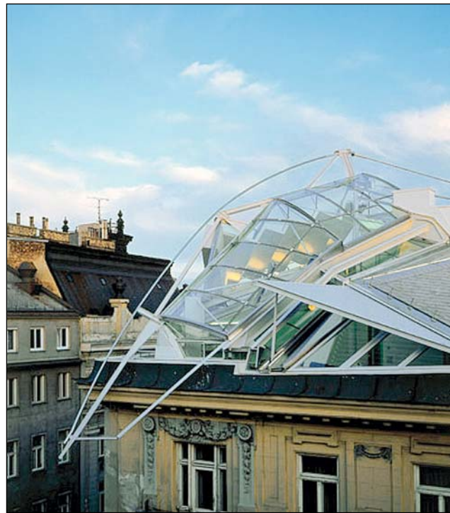
L'attico di Coop Himmelb(l)au in Falkestrasse a Vienna (1988)

Un'interpretazione stimolante, anche se non sempre convincente