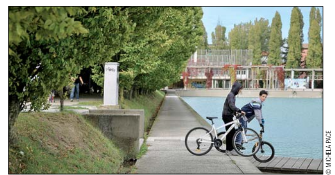
Parco della Bissuola, Mestre (Studio Laris e Studio Costa-Gualdi, 1979)

Questo volume dà pensiero a uno scarto possibile rispetto alla trionfante ideologia economicistico-monetarista. Apparentemente propone questioni antiche: un'indagine delle relazioni fra pratiche sociali e qualità degli spazi urbani. Terreno scivoloso per urbanisti e architetti affetti da volontà di potenza, ma l'approccio è diverso, attento ai fenomeni, capace di descrivere la povertà della città modernista senza facili nostalgie, cercando anzi con ostinazione le tracce di un possibile, di un ancora possibile. Non un nuovo ordine dello spazio, ma una riflessione sull'origine della spazialità urbana colta nel suo apparire,