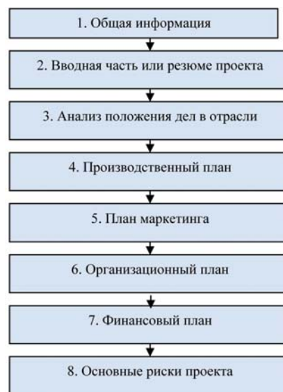
Рис. 4. Структура бизнес-плана, рекомендуемая ОАО «Банк ВТБ»

долины, которая участвовала в финансировании ряда чрезвычайно успешных компаний, среди которых Google, Yahoo, Paypal, Apple, YouTube, LinkedIn, Admob, Zappos, Airbnb и Instagram.