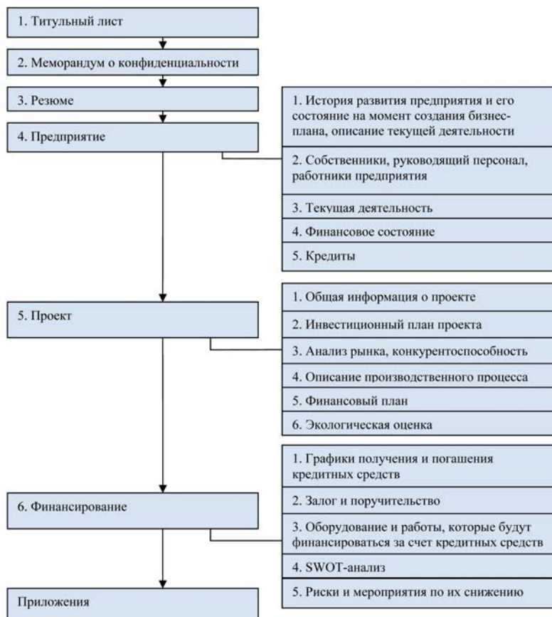
Рис. 2. Методика бизнес-планирования, предлагаемая ЕБРР [10]

Практически все методики по оценке инвестиционных проектов, существующие в мире на сегодняшний день, основываются на методике разработанной UNIDO еще в 70-х годах. Эта методика обеспечивает сбор всей необходимой информации для осуществления прогноза движения денежных средств, и для оценки проекта с использованием количественных показателей. Методика бизнес-планирования, предлагаемая ЕБРР (Европейский банк реконструкции и развития) имеет следующую структуру [10] (рис. 2).