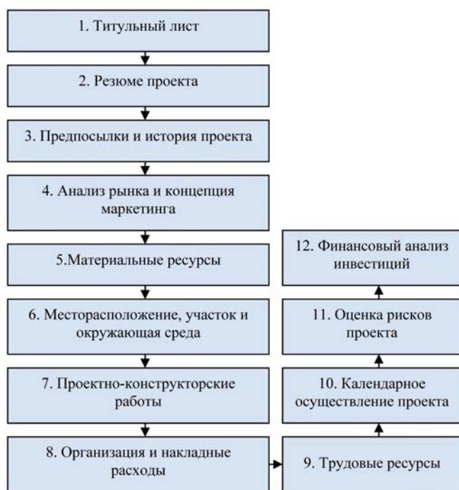
Рис. 1. Структура инвестиционного проекта (UNIDO)