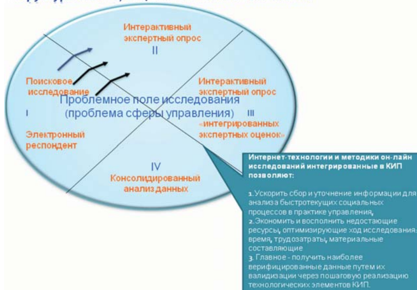
Рис. 1. Комплексный интерактивный продукт

Методология и методика сбора данных. Целью поискового онлайн – исследования была проверка при помощи социотехнической технологии дистанционного сбора и анализа данных возможностей социально-организационного зонирования экономических и технологических пространств, включенных в кластерную политику в рамках концепции инновационной индустриализации [5].