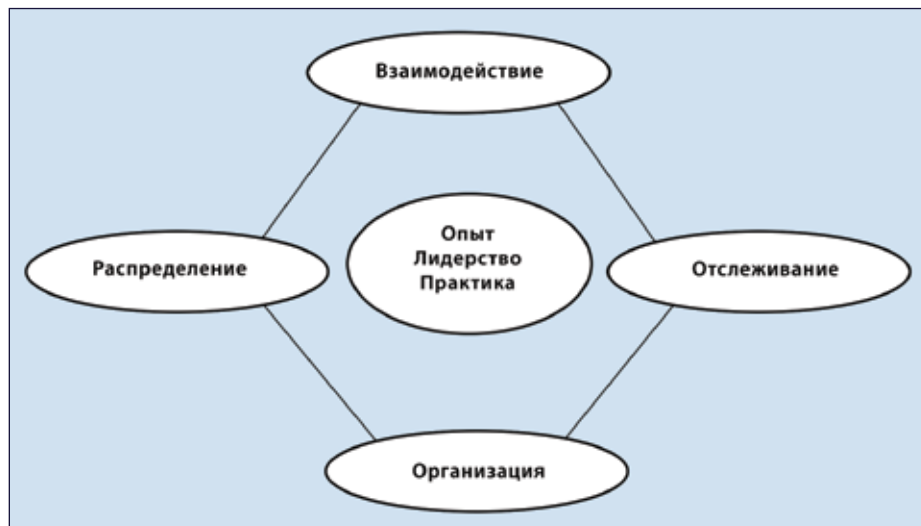
Рис. 3. Навыки исполнения

тия, время, составлять бюджет денежных средств и других ресурсов.