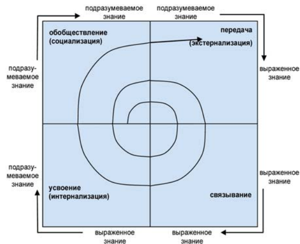
Рис. 3. Процесс обучения организации, по Нонака

Процесс обучения организации, по Нонанке, представлен на рис. 3. В результате постепенного включения новых знаний в «знаниевую» базу и перевода их в форму подразумеваемых знаний формируется основа, которая является средой для создания новых знаний, которые, пройдя аналогичный цикл преобразований, также включаются в основу.