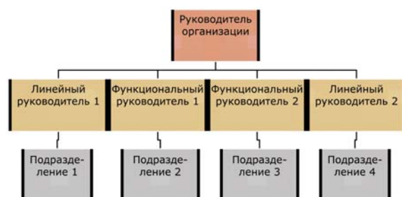
Рис. 4. Линейно-функциональная структура управления

При этом менеджмент среднего звена организации делится на линейных руководителей, управляющих структурными подразделениями, и функциональных руководителей, в ведении которых находятся функциональные службы и отделы [1]. Линейный руководитель в такой структуре управления несет всю полноту ответственности за деятельность своего подразделения, а функциональный руководитель отвечает за качество выполнения предписанных его службе функций в масштабах всего предприятия, как в структурных, так и в функциональных подразделениях. Упрощенная схема построения линейно-функциональной ОСУ представлена на рис. 4.