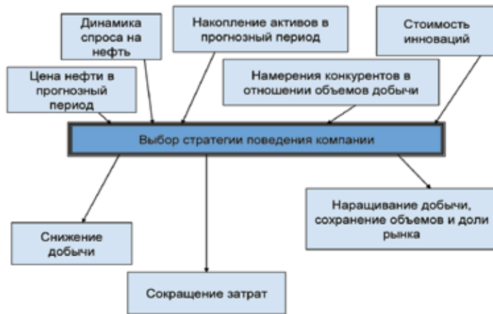
Рис. 1. Схема взаимодействия факторов, влияющих на выбор стратегии нефтяной компании