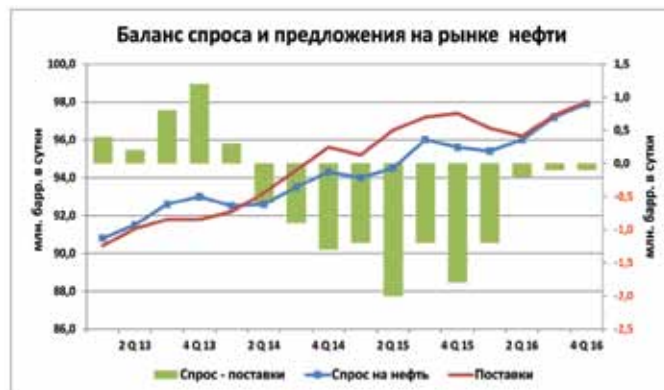
Рис. 5. Баланс спроса и предложения на рынке нефти Fig. 5. Balance of supply and demand in the oil market

В период с 1 кв. 2013 г. по 2 кв. 2014 г. рынок испытывает дефицит поставок нефти в интервале от 0,22% до 1,29%. В период со 2 кв. 2014 г. по 1 кв. 2016 г. на рынке наблюдается существенный профицит поставок нефти, в интервале от -0,66% до -2,12%. В период со 2 кв. 2016 г. по 4 кв. 2016 г. рынок постепенно балансируется (-0,2, 0,2). На рис. 5 и 6 показаны графики изменения баланса спроса и предложения на рынке.