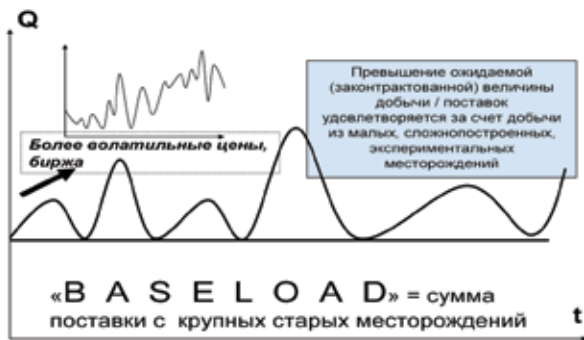
Рис. 3. Принципиальная схема нефте- и газоснабжения в условиях зрелого четвертого технологического уклада