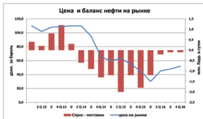
Рис. 6. Цена и баланс нефти на рынке Fig. 6. The price and balance of oil in the market