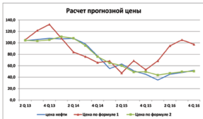
Рис. 7. Расчет прогнозной цены