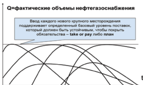
Рис. 2. Принципиальная схема нефте- и газоснабжения в условиях третьего технологического уклада

Наиболее показателен с точки зрения модели энергообеспечения третий технологический уклад (рис. 2). Его отличительные черты: легкая нефть, крупные месторождения с различными датами ввода и длительностью сроков рентабельной эксплуатации. Благодаря возможности для компаний относительно легко восполнять исчерпывающиеся запасы за счет ввода в эксплуатацию новых, формируется достаточно устойчивый уровень предложения нефти, который юридически оформляется как рынок долгосрочных контрактов.