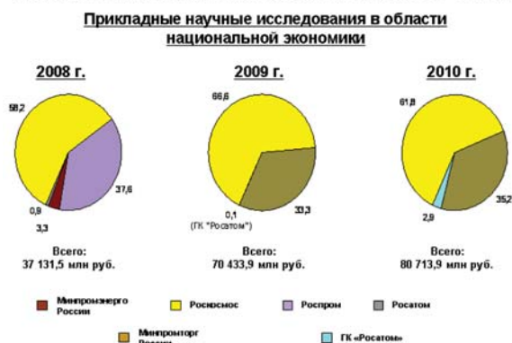
Рис. 1. Научные исследования в области национальной экономики 1

оборонно-промышленного комплекса средств для сохранения своих мощностей становится внешне-экономическая деятельность.