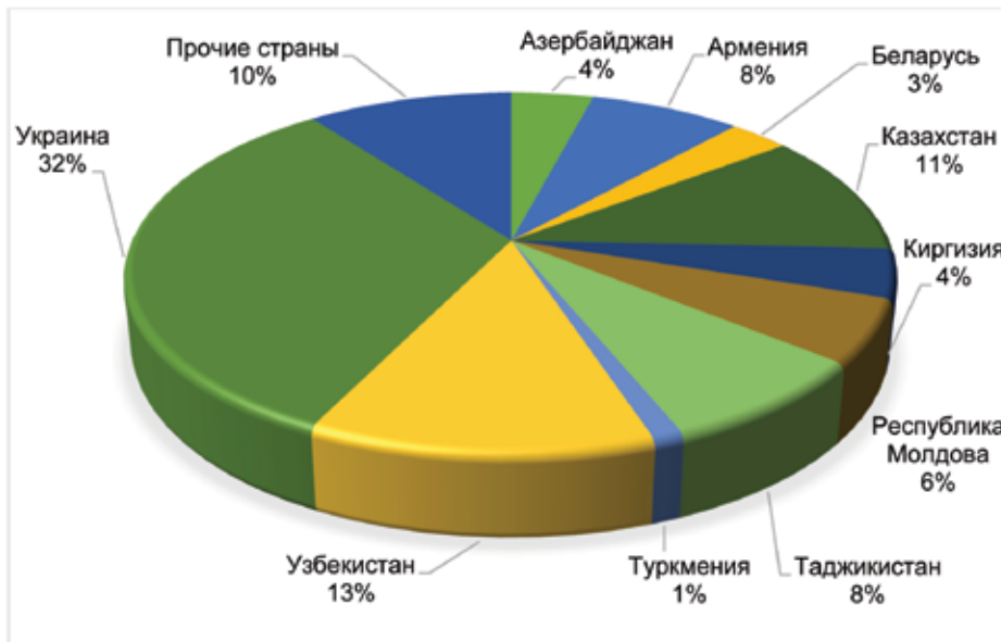
Рис. 2. Структура притока мигрантов в Российскую Федерацию в разрезе стран (по состоянию на 2015 год) 2

ся косвенным свидетельством того, что в Беларуси сохраняется определенная социально-экономическая стабильность, обеспечивающая нормальную занятость населения.