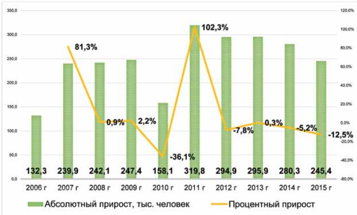
Рис. 1. Динамика миграционного прироста населения Российской Федерации в результате миграционного обмена с зарубежьем 1