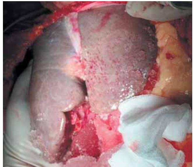
Рис. 2. Вид донорской печени после окончания перфузии