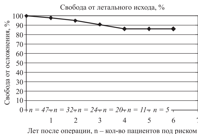
Рис. 2. Актуарная выживаемость в отдаленные сроки (по методу Каплана–Майера)

Таким образом, комбинация 2 стратегий низкого риска, БАП (1% смертности) с изолированной клапанной хирургией (от 0,7 до 4% смертности) является благоприятной, чтобы уменьшить операционный риск [9]. Brinster и др. сообщили относительно 18 пациентов, средний возраст которых 76 лет, с сочетанной коронарной и клапанной патологией. Вместо расширенной операции АКШ с протезированием клапана в этом возрасте использовалась БАП со стентированием (стенты с покрытием), сопровождаемая в ближайшие 24 ч протезированием