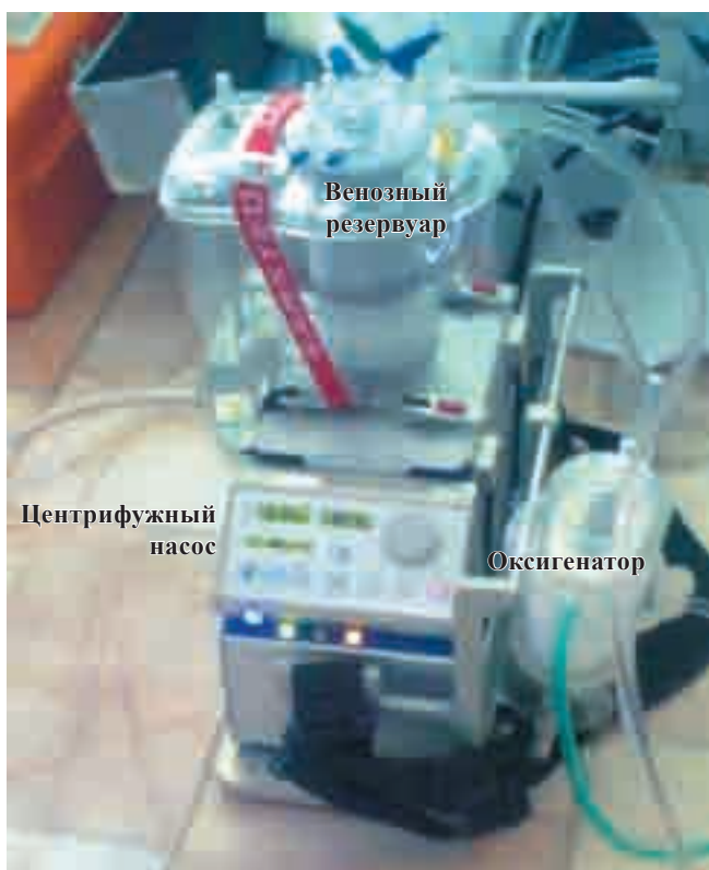
Рис. 3. Контур ЭКМО, заполненный и подготовленный к работе

После констатации смерти пациента вследствие необратимой остановки сердечной деятельности одновременно двумя хирургами выполняются продольные разрезы в проекции бедренных сосудов. С одной стороны выполняется канюляция бедренной артерии и вены канюлями для экстракорпоральной перфузии, с другой стороны канюлируется только бедренная артерия двухбаллонным трехпросветным катетером. Верхний (торакальный) баллон