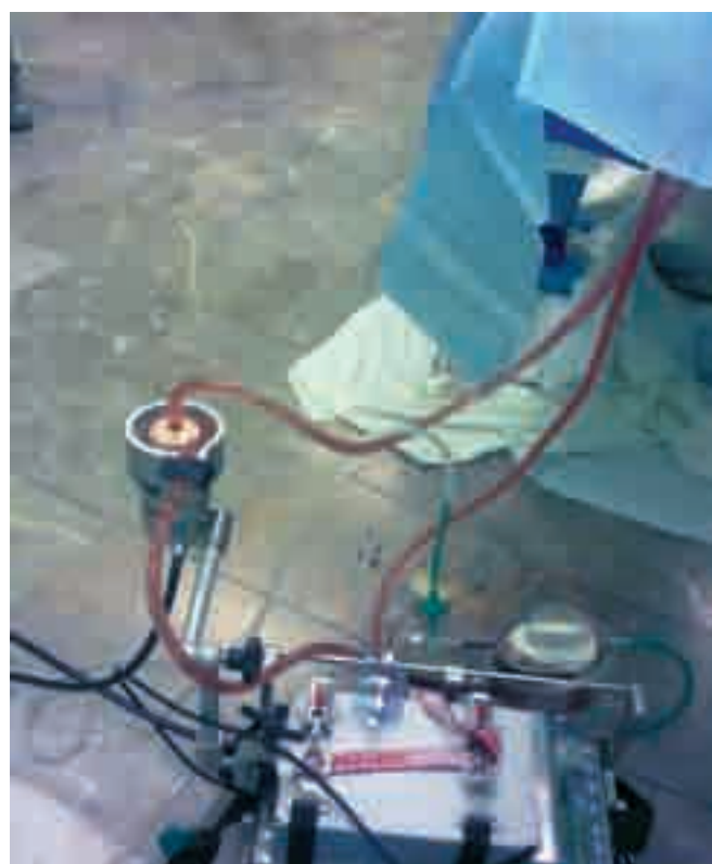
Рис. 4. Использование контура ЭКМО для перфузии органов консервирующим раствором «Кустодиол»