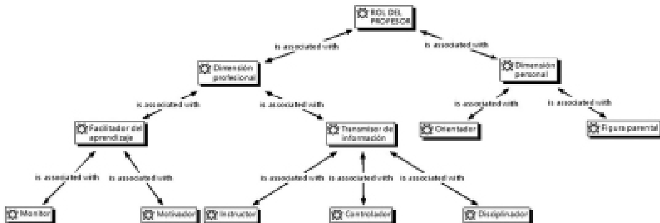
Figura 1. Red conceptual asociada a creencias sobre el rol del profesor

En el marco de la red conceptual relacionada con las creencias que poseen los futuros docentes sobre el rol del profesor de inglés es posible identificar como primera subcategoría una dimensión profesional , la cual se encuentra directamente ligada con el ejercicio docente. En este contexto, cuando los participantes son consultados sobre las acciones que deben llevar a cabo en el aula, algunos señalan que una de sus funciones corresponde a ser un facilitador del aprendizaje . Relativo a lo anterior, un docente en formación señala: “Creo que el profesor debería actuar como un mediador y facilitador del aprendizaje, ayudando a los alumnos a comprender el lenguaje dentro de un contexto” (E14 [06:06]). Asimismo, otro de los entrevistados parece poseer una perspectiva similar: “Para que los estudiantes pudiesen leer el texto en inglés, yo los guíe, facilitándoles ejemplos sobre las palabras que ellos desconocían. Realicé esto para que ellos cumplieren con los objetivos de la clase” (E08 [44:44]). Desde este punto de vista, los sujetos asocian el rol del profesor con el de un agente que promueve y guía la construcción de aprendizajes por parte de los estudiantes en el área de especialidad.