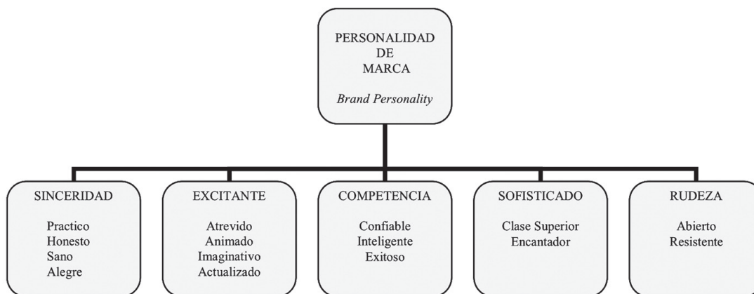
Figura 1. Modelo de personalidad de marca de Aaker (1997).