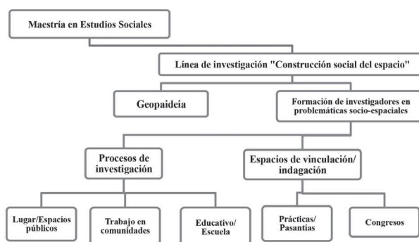
Figura 1: Estructura general de la línea Construcción Social del Espacio Maestría en Estudios Sociales – UPN

La riqueza de divulgar el trabajo que se desarrolla desde la línea de investigación CSE 5 radica en la posibilidad de hacer ejercicios comparativos con otras comunidades afines que también trabajan con problemas socio-espaciales de interés actual. En lo que se refiere al plano de las pasantías (ya sean en el ámbito local o en el exterior) tener la oportunidad de incursionar en otros espacios, permite pensar el problema de investigación desde nuevas perspectivas que incluyen no solo revisar documentación específica a la cual no se tiene fácil acceso, sino obtener retroalimentación desde otros campos disciplinares y perspectivas de docentes – investigadores expertos en campos de indagación afines.