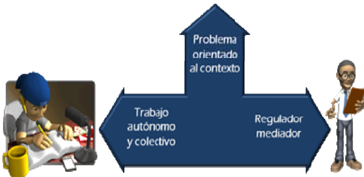
Grafica 2. Articulación de metodología ABP utilizada con estudiantes de educación media

La grafica que se presenta a continuación relaciona los elementos constitutivos de la metodología implementada.