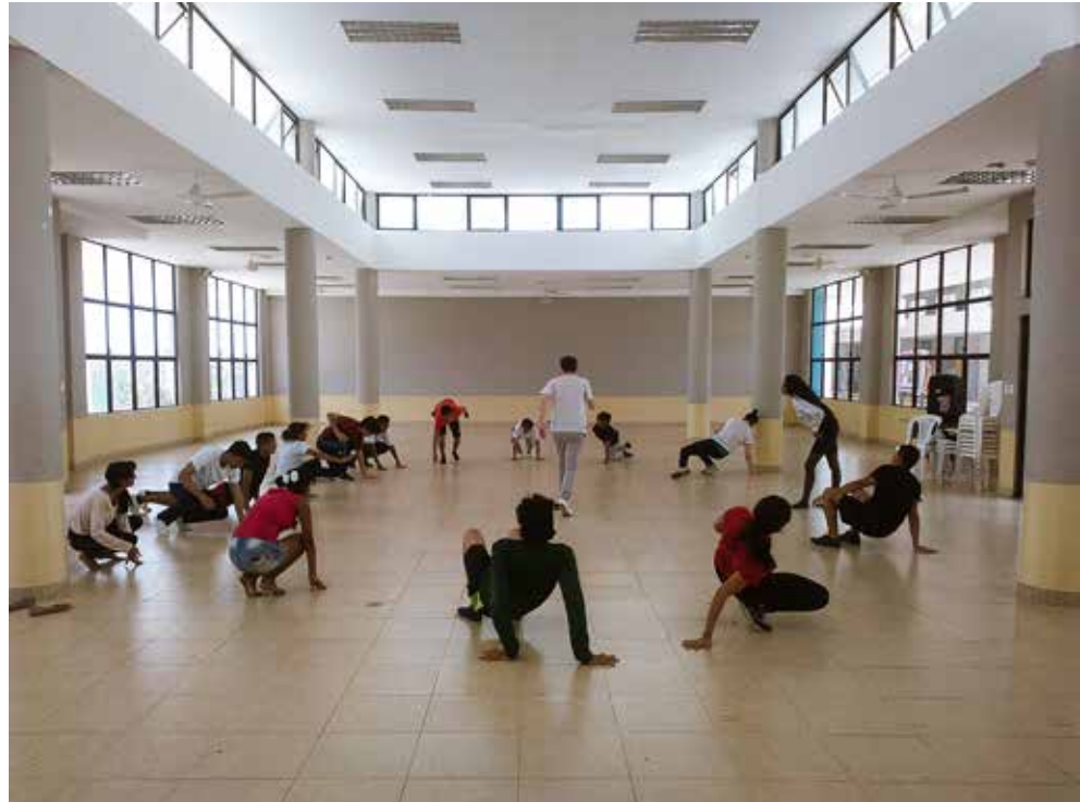
Imagen 4. Puesta en escena de la coreografía. Segunda parte