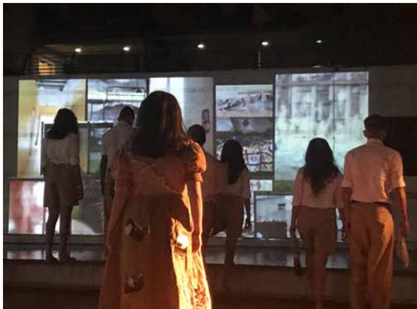
Imagen 6. Foto del estreno de la obra. En primer plano, los cuerpos de los performer. Al fondo, la proyección de las casas

El video, junto con la fotografía sublimada, se convertía en un elemento más que unía lo poético a la vida común, a la intimidad, de tal manera que toda esta acción correspondía al performance del texto de José Luis Pardo, en tanto que cada uno de ellos, cada una de las niñas que intervenían exponía ante públicos diversos el interior de su hogar. Casas humildes producto de la invasión, ahora ocupaban las paredes del MAAC como acto que pretendía configurarse en huella.