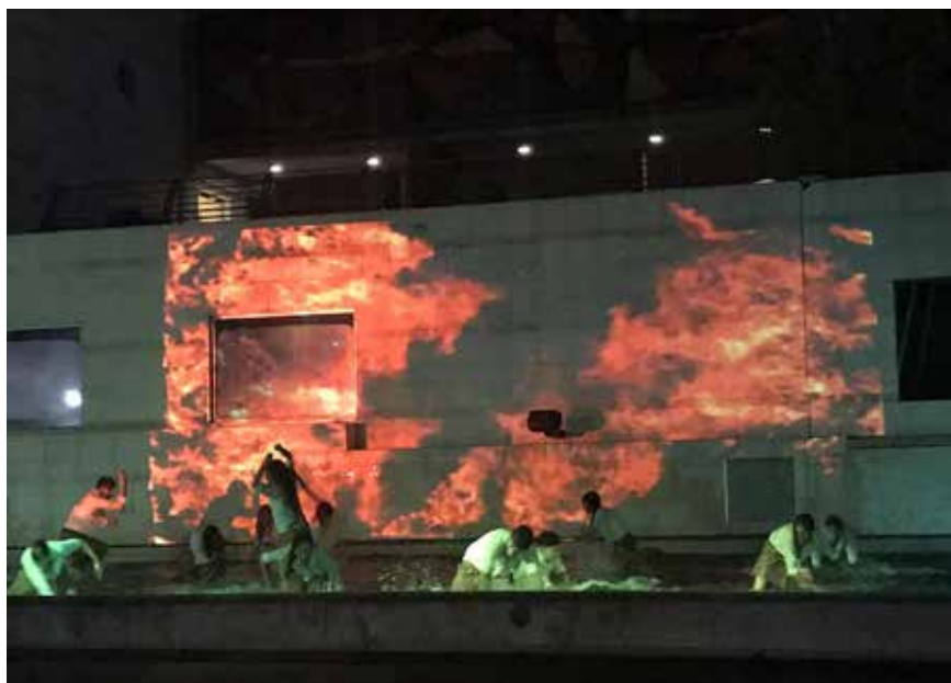
Imagen 9. Foto del estreno de la obra. Escena final

Es desde ese escenario corporal, audiovisual, que se abría la conversación entre todos quienes hacían presencia allí y que ponían en discusión sus sensaciones, sobre lo que significan estas sobrevidas. Por este motivo que se puede decir, sin temor alguno, que el performance Reflejos se convirtió en activador, en potencializador 6 de afectos, pensamientos, saberes que procedían de los cuerpos de los jóvenes en acción. Un accionar que iba de movimientos contenidos hasta desbordados, como sucede al final de la obra cuando el fuego ( video mapping ) traduce un sentimiento de impotencia y rabia frente al maltrato al que son sometidas algunas de las niñas del colectivo (ver imagen 9).