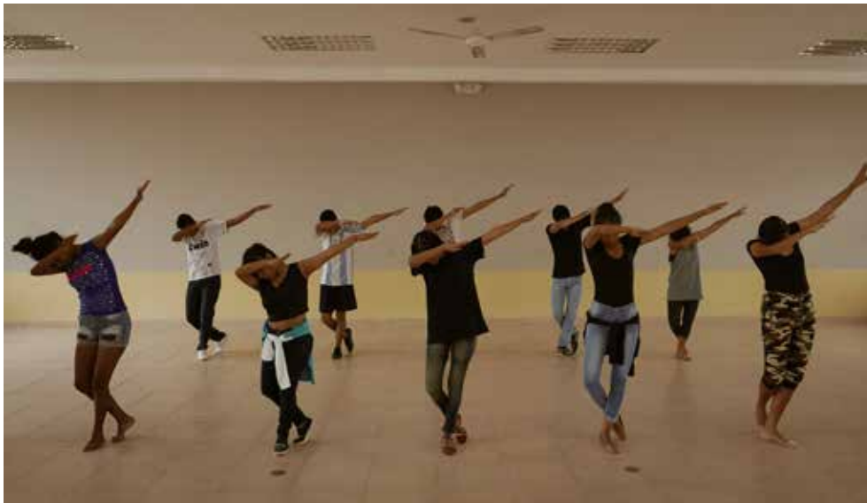
Imagen 3. Puesta en escena de la coreografía. Primera parte

El laboratorio de creación a través del trabajo del cuerpo, el relato y la imagen, configuró un espacio de cruce, de hibridación que hizo posible la presencia de cada joven. Este espacio al ser comprendido como fase liminal, como momento temporal que divide la vivencia y convivencia del joven que pertenece a la institución colegio, causó una transformación de la mirada de quienes estuvieron presentes en ese cronotopo. “La fase liminar fascinaba a Turner porque reconocía en ella una posibilidad del ritual para ser creativo, para abrir el paso a nuevas situaciones, identidades y realidades sociales” (Schechener, 2012, p. 114).