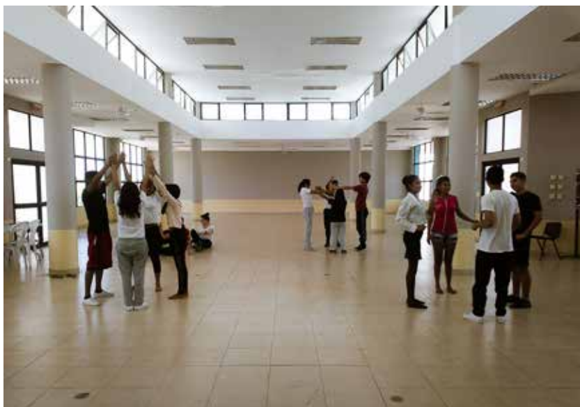
Imagen 2. Creación de partituras de movimiento

restringidas, golpes, deseos de huir, gritos. Acciones, todas ellas, referidas a un emocionar, pero también a un reaccionar sobre su vida, a un mostrar-se como seres frágiles con deseos de ser escuchados, acogidos, respetados, amados.