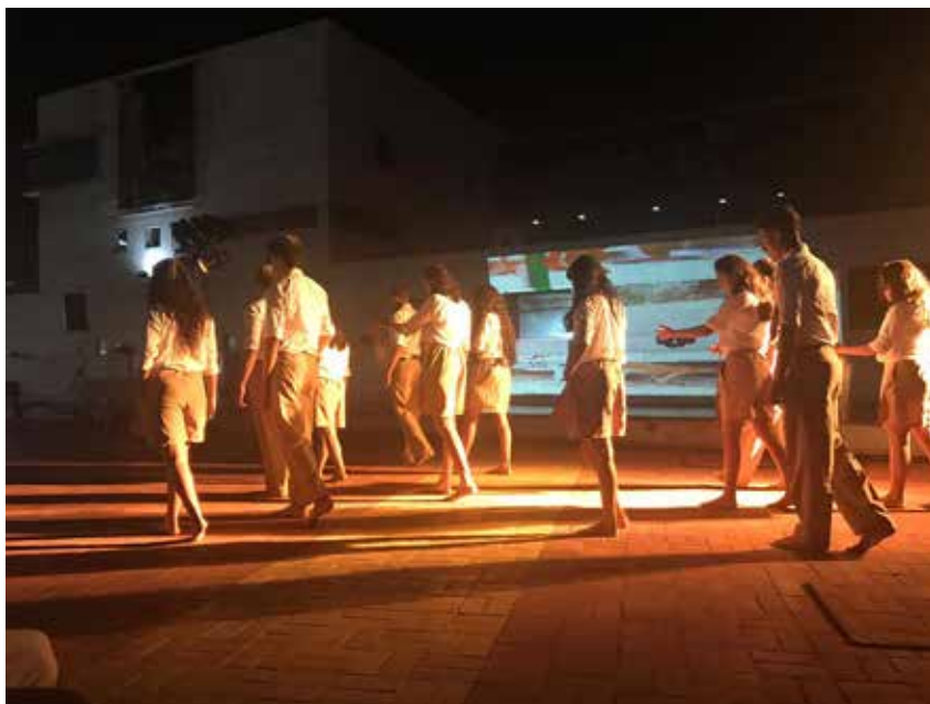
Imagen 5. Foto del estreno de la obra

Cada uno tiene una vida, una forma de entender la/su realidad, una manera de mostrarla a los demás. Por ello, los uniformes de colegio, en cuanto objeto, fueron intervenidos de tres formas. La primera de ellas, en términos de color. La idea de cambiar la apariencia estaba asociada a poner de presente que los doce estudiantes además de sí mismos, representaban al universo escolar. Cada uno es el reflejo de otro estudiante, cualquiera que este fuera.