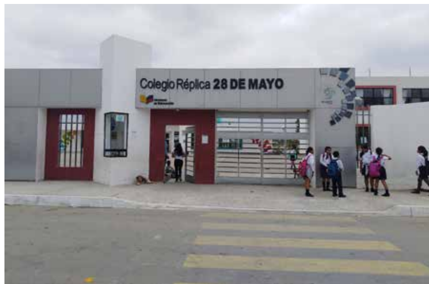
Imagen 1. Colegio Réplica 28 de Mayo