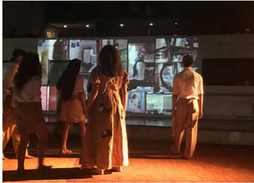
Imagen 7. Foto del estreno de la obra. Al fondo la proyección, de las casas