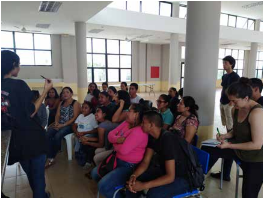
Imagen 8. Reunión con las madres de los jóvenes performers