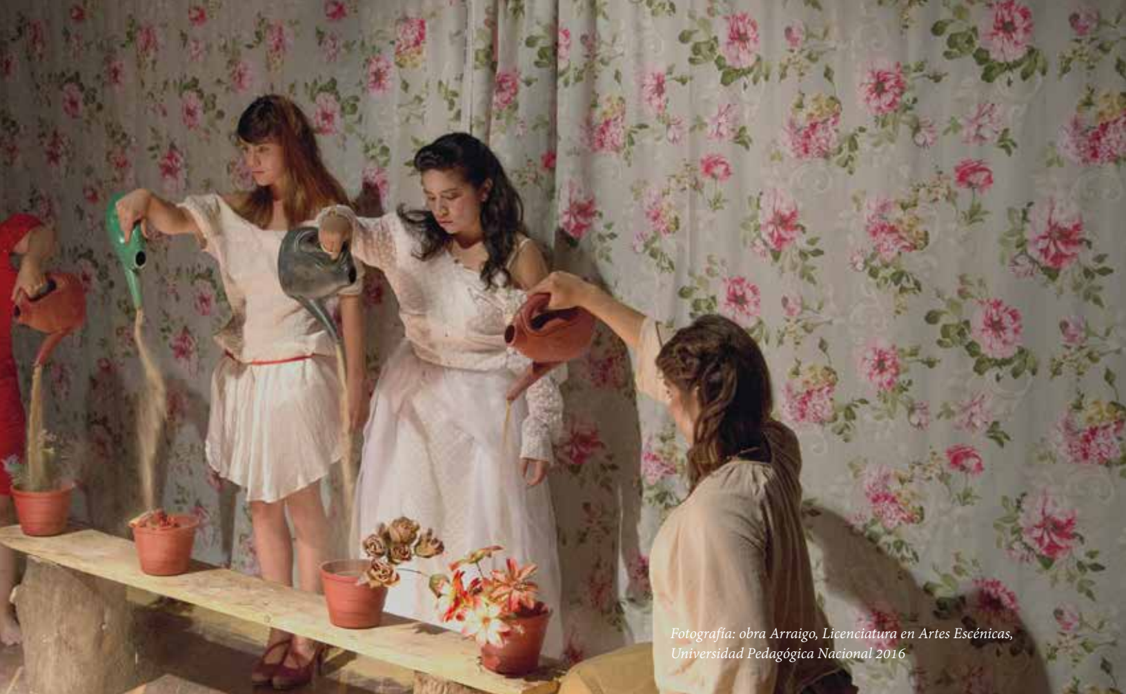
Fotografía: obra Arraigo , Licenciatura en Artes Escénicas, Universidad Pedagógica Nacional 2016