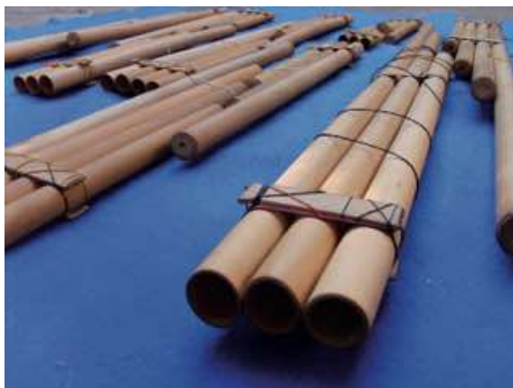
Figura 3. La familia de los Julas Julas

Los sikus utilizados para interpretar los julas julas son flautas de pan complementarias de tres o cuatro tubos, organizadas en cinco grupos de diferentes dimensiones: Jula-Jula Orkho (el más grande, sirve de guía), Jula-Jula Mali (el mediano), Jula-Jula Liku (que significa «estrellita» en Aymara), Jula-Jula Tijli y Jual-Jula Ch'ili (el más pequeño). Los diferentes tamaños corresponden a intervalos de una octava. Cada octava está a cargo de un par de sikus «hermanos» (Arka e Ira), con una distribución de las notas de la siguiente manera: 1