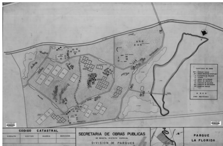
Imagen 2. División del parque La Florida de Bogotá. (Instituto de Desarrollo Urbano, 2016).

La caracterización de los estratos de vegetación, realizó siguiendo la propuesta de Marín & Parra (2015) la cual contempla las siguientes formas de crecimiento de interés para el presente trabajo: