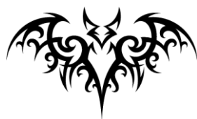
Imagen 3. Imagen acompañante a la pregunta.

Otro tipo de explicación es aquella que relaciona las imágenes acompañantes de la pregunta con la respuesta, como en el caso de (F): “Como conocemos el huella de este murciélago (...) en un rincon hay parece (...) en un pared”. En ésta el estudiante responde vinculando la pregunta con la imagen 3 que la acompaña; aunque el murciélago no camina, si deja un rastro en la pared, a este rastro también lo podemos clasificar en la categoría de huella.