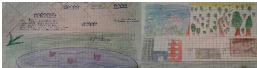
Im genes 1. Ambiente desde la visi n humanista (Dibujo Izquierda E8 y Dibujo derecha E26)

Tambi n se encontr  que el 11,5% de los estudiantes comprenden el ambiente desde la corriente humanista, dado que lo reconocen como el lugar donde se ubica tanto los escenarios naturales como los urbanos, una zona donde no s lo habitan animales y plantas sino tambi n se encuentran e interaccionan los humanos, por ejemplo el E.8 menciona “El medio ambiente es un lugar o ecosistema donde habitan seres vivos como animales, plantas y humanos” as  mismo el E26 dice “Es la uni n de varias personas no solo donde hay plantas sino donde tambi n hay urbanizaci n” , seg n Suave (2004), la corriente humanista permite identificar al sujeto dentro del ambiente, donde se reconoce su interacci n directa y se concibe como parte del ambiente, es por tanto el resultado de la alianza entre lo natural con la construcci n antr pica.