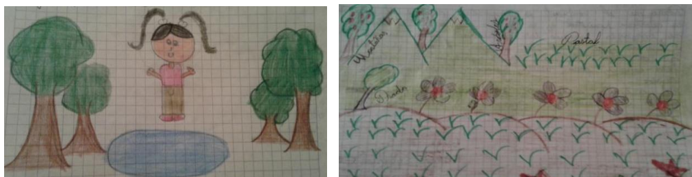
Imagen 2. Visión naturalista de ambiente. (Dibujo Izquierda E13, Dibujo derecha E3)

respiratorios, que hacen a cada animal diferente... hay tanto animales en el agua, como en el cielo y en la tierra”, estos son evidencia de la concepción de ambiente que poseen los estudiantes también desde su interacción permanente, dado seguramente la mayoría de ellos viven en una zona semiurbana, caracterizada por poseer diferentes ecosistemas.