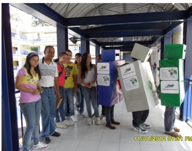
Foto 3. Jornadas de sensibilización sobre la separación en la fuente de los residuos sólidos generados en el ITM.

La proyección del semillero a nivel institucional es participar con proyectos de investigación, educación y sensibilización ambiental apoyando el Sistema de Gestión Ambiental (SGA-ITM). Con estas iniciativas el semillero pretende ser en el año 2015 líder en materia ambiental en el ITM, con gran impacto a nivel regional y nacional.