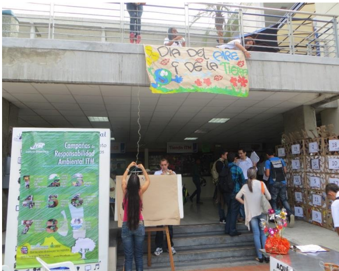
FOTO 1. Jornada de estimación de la Huella de Carbono “Calcula tu Huella”, lidera por el Semillero.

en kWh, por lo tanto la otra opción era estimar la huella de este factor con relación al consumo promedio de la población colombiana según la base de datos que respalda este aplicativo de Ecopetrol, la cual no cambio durante este tiempo. Para el factor de alimentación de igual forma no hay variación entre un año y otro, con un valor de 0.70 ton CO 2 /año, ya que la mayoría de los participantes manifestó comer carne día de por medio (3 veces/semana), lo que correspondía a una dieta baja en carne. El factor más determinante y que marcó más la diferencia fue la estimación de la HC en la movilidad, mostrando una reducción de 3.13 a 2.78 ton CO 2 /año entre los años 2011 y 2012. Esto puede tener diversas explicaciones que están fuera del alcance de esta muestra estadística, sin embargo puede pensarse en un incremento en el uso de transporte masivo, un incremento en los recorridos caminando o en bicicleta por parte de los estudiantes especialmente.