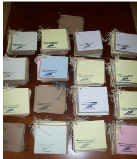
FOTO 2. Libretas elaboradas con el papel kraft reutilizado en la muestra de estimación de la Huella de Carbono.

La huella de carbono correspondiente a transporte representó entre el 74.2 y 71.2% del valor total, para los años 2011 y 2012 respectivamente, esto hace que la movilidad sea el principal factor a tener en cuenta si se desea disminuir o mitigar su impacto ambiental. Los resultados de los factores de alimentación y energía