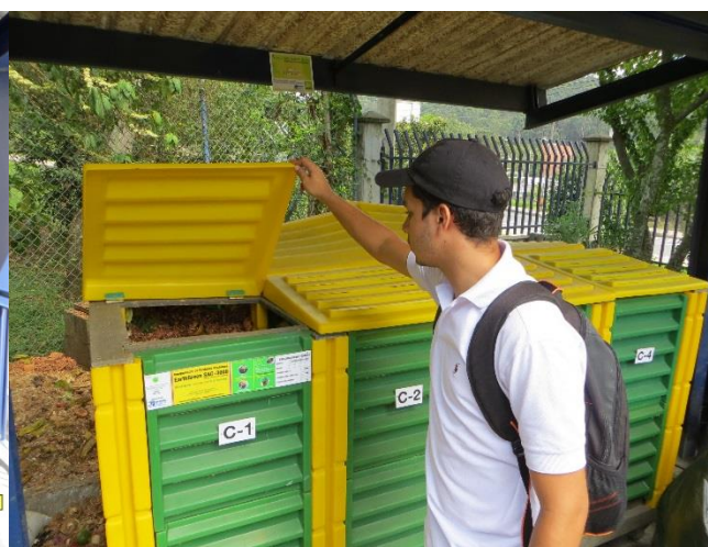
Foto 4. Compostador para residuos sólidos orgánicos provenientes de las cafeterías.