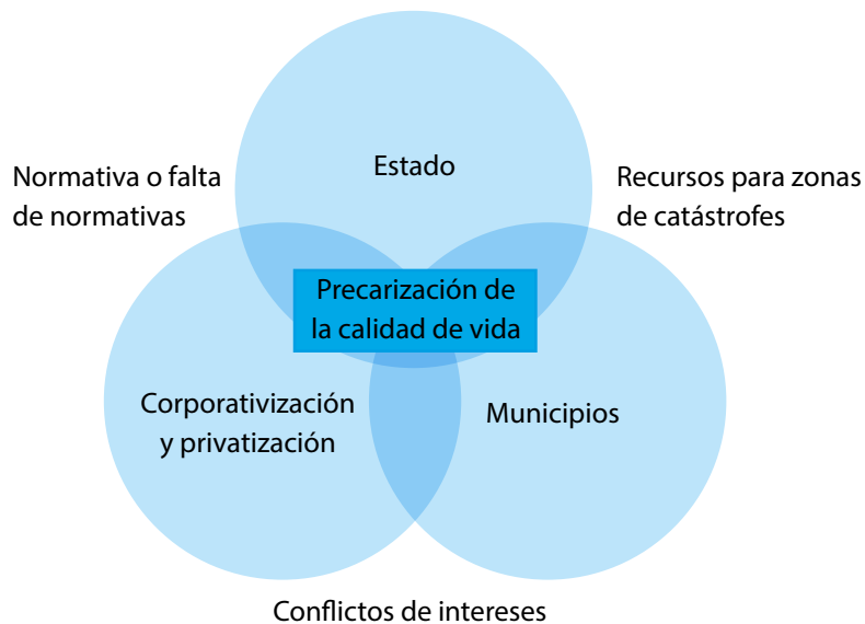
Figura 2. El ciclo de la desposesión