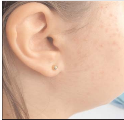
Рис. 5. Припухлость правой околоушной области в период обострения паротита

Для верификации диагноза СШ мы использовали Российские диагностические критерии, опубликованные в 2001 г. [12]. Классификационные критерии болезни Шёгрена ACR/EULAR, которые были предложены в 2016 г. [13], сложны для применения у детей, так как далеко не во всех случаях возможно выполнение биопсии малой слюнной железы, а также адекватное проведение нестимулированного теста Ширмера и определение нестимулированной секреции слюнной железы. По мнению N. Yokogawa и соавт. [14], диагностическая значимость критериев СШ для взрослых в педиатрической практике невысока, что может влиять на выявляемость СШ в этой возрастной группе. В последнее время большую роль в диагностике СШ играют результаты УЗИ слюнных желез, которое является неинвазивным, необлучающим методом визуализации, продемонстрировавшим, согласно заключению ряда авторов, хорошую чувствительность и высокую специфичность (до 94%) [9, 15]. По данным нашего ранее опубликованного исследования, 100% пациентов, у которых был верифицирован СШ, имели патогномичные УЗИ-признаки [8]. Результаты УЗИ, рецидивирующий паротит и обязательное выполнение биопсии малой слюнной железы для выявления специфической морфологической картины предложены N. Yokogawa и соавт. [14] в качестве дополнительных критериев для пациентов детского возраста. У нашей пациентки на основании