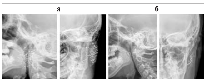
Рис. 4. Сиалография до (а) и после 5 курсов (б) терапии РТМ

раженная медиастинальная и аксиллярная лимфаденопатия. При комплексном стоматологическом обследовании, включавшем консультацию стоматолога, проведение сиалометрии и сиалографии (рис. 4, а), установлен паренхиматозный паротит выраженной стадии со снижением функции слюнных желез. Пациентке была выполнена биопсия малой слюнной железы, выявлены морфологические проявления СШ, выраженная нестабильность ядерного материала. При иммунохимическом анализе крови и мочи обнаружена поликлональная гипергаммаглобулинемия, пациентка была обследована онкогематологом, данных в пользу лимфопролиферативного заболевания не выявлено.