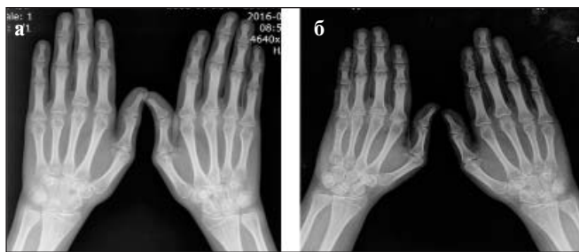
Рис. 2. Рентгенограммы кистей до (а) и после 5 курсов (б) лечения РТМ