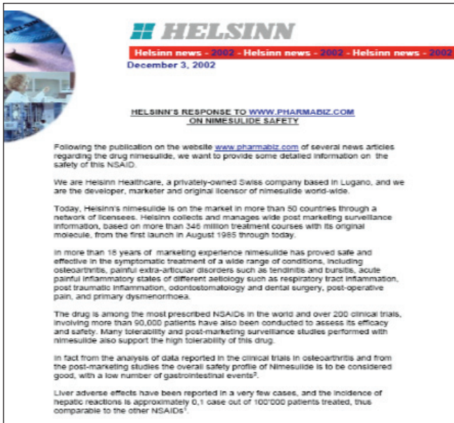
Рис. 2. Отчет разработчиков нимесулида