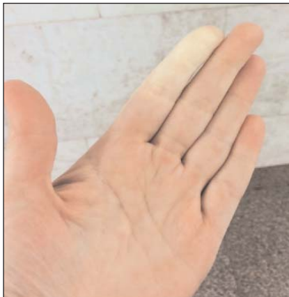
Рис. 1. Синдром Рейно у пациентки с дебютом АНЦА-СВ