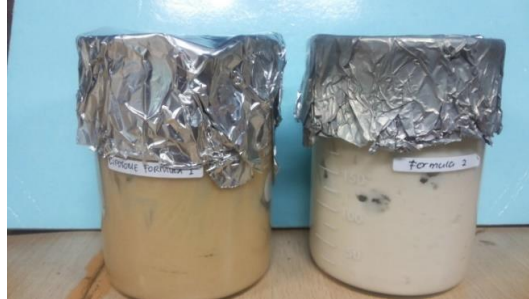
Gambar 2. Formula 1 dan 2 krim ekstrak buah mengkudu.

polifenol total menggunakan spektrofotometri UV-Vis dan hasil yang diperoleh sebesar 180 \mu\text{g} GAE/g ekstrak.