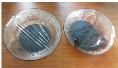
Gambar 1. Ekstrak Mengkudu