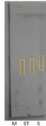
Gambar 3. Optimasi Maserasi dan Sonikasi (5, 10, dan 15) Secara Visual

Proses yang dilakukan sama dengan proses KLT pada optimasi maserasi dan sonikasi. Warna yang dihasilkan saat disemprot anisaldehyd asam sulfat dan saat dilihat di bawah lampu UV yaitu keunguan seperti pada Gambar 3 dan 4.