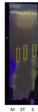
Gambar 4. Optimasi Maserasi dan Sonikasi (5, 10, dan 15) pada Lampu UV 366 nm

Nilai Rf yang dihasilkan yaitu standar asiatikosida 0.5, Rf maserasi = 0.45, dan Rf sonikasi = 0.43. Perbedaan nilai Rf bisa diakibatkan karena faktor teknis perlakuan saat KLT.