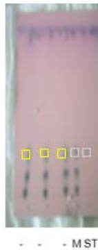
Gambar 1. Optimasi Maserasi dan sonikasi (5, 10, dan 15) Secara Visual

ekstrak pegagan masing-masing untuk maserasi dan sonikasi 10 mg/mL metanol, menggunakan eluen dengan perbandingan kloroform:metanol:asamasetat glasial (22:8:4). Pada penelitian ini pada senyawa asiatikosida pada ekstrak setelah dipanaskan, disemprot anisaldehyd asam sulfat menghasilkan warna ungu yang sejajarseperti pada Gambar 1., kemudiandiikuti noda senyawa asiatikosidadi bawah lampu UV dengan panjang gelombang 366 nm berwarna ungu yang ditunjukkan Gambar 2. hasil yang didapat, pada Rf standar asiatikosida terletak pada 0.23. Rf optimasi maserasi terdapat pada 0.23 Rf optimasi sonikasi 5 menit Rf = 0.21, 10 menit Rf = 0.21, dan Rf 15 menit = 0.23.