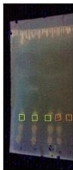
Gambar 2. Optimasi Maserasi dan sonikasi (5, 10, dan 15) Pada Lampu UV 366 nm